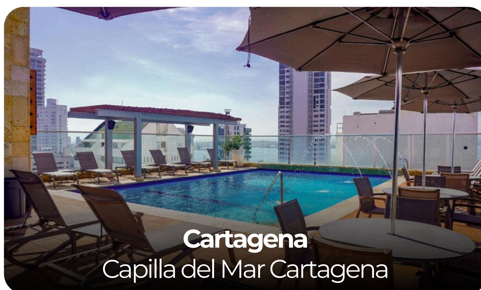
Cartagena Capilla del Mar Cartagena