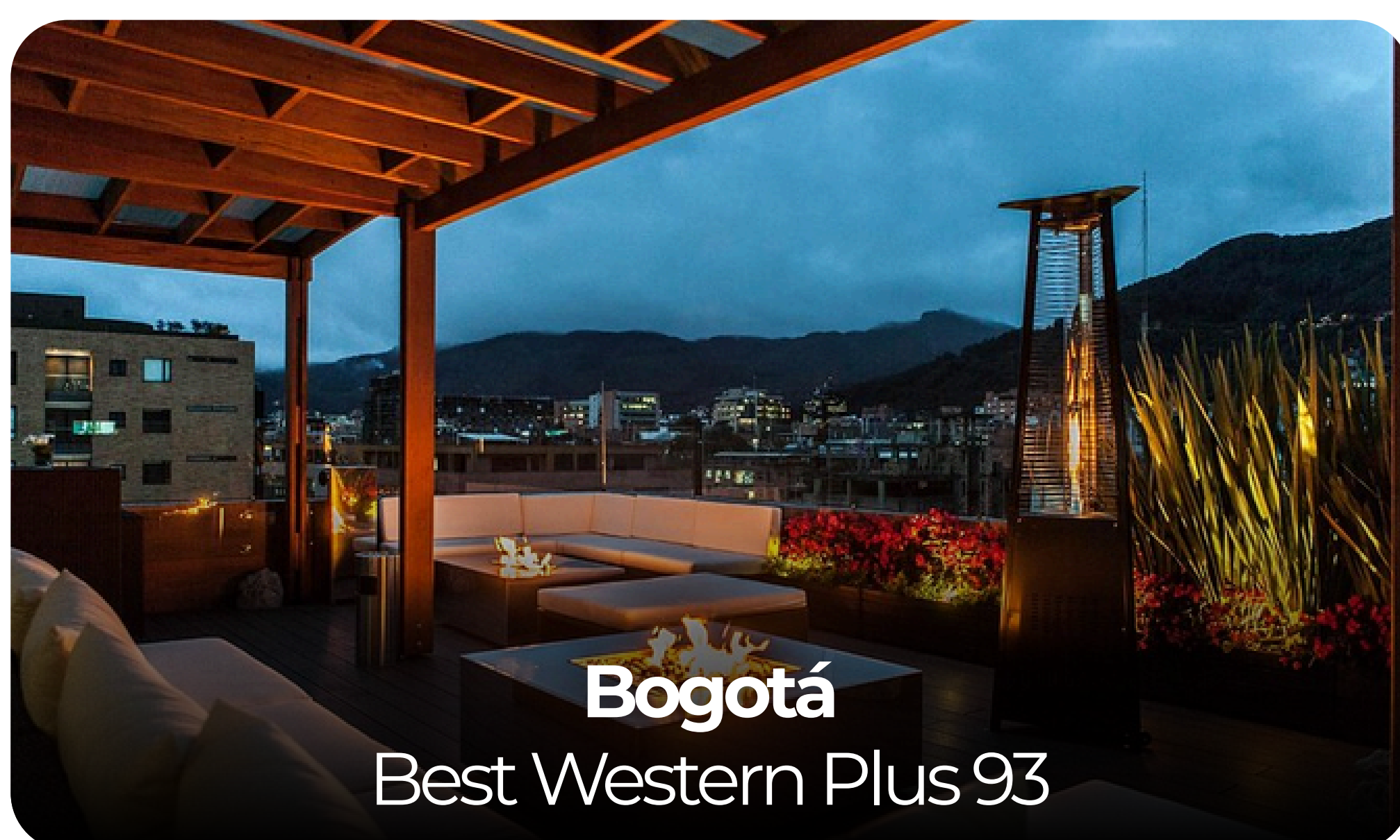
Bogotá Best Western Plus 93