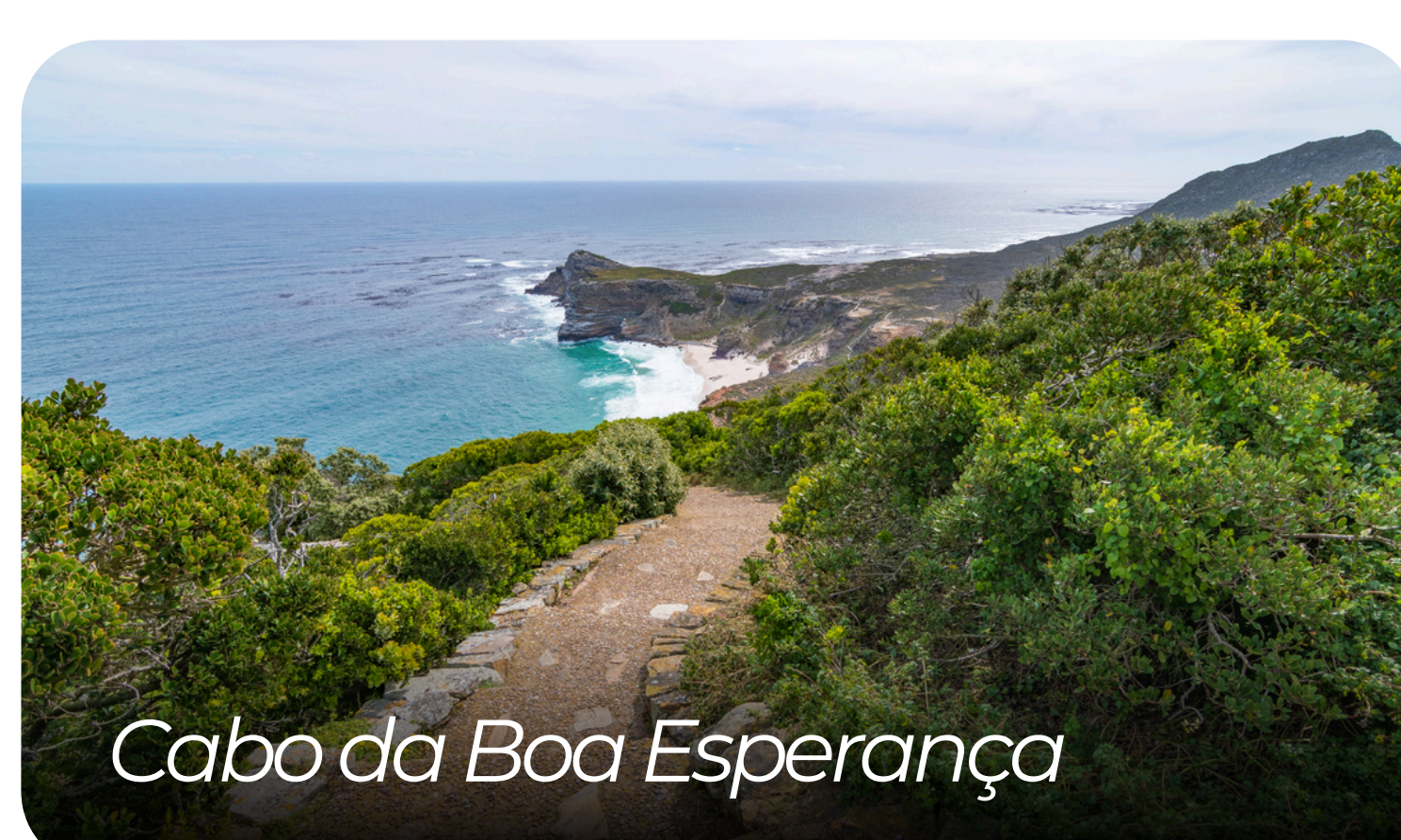
Cabo da Boa Esperança