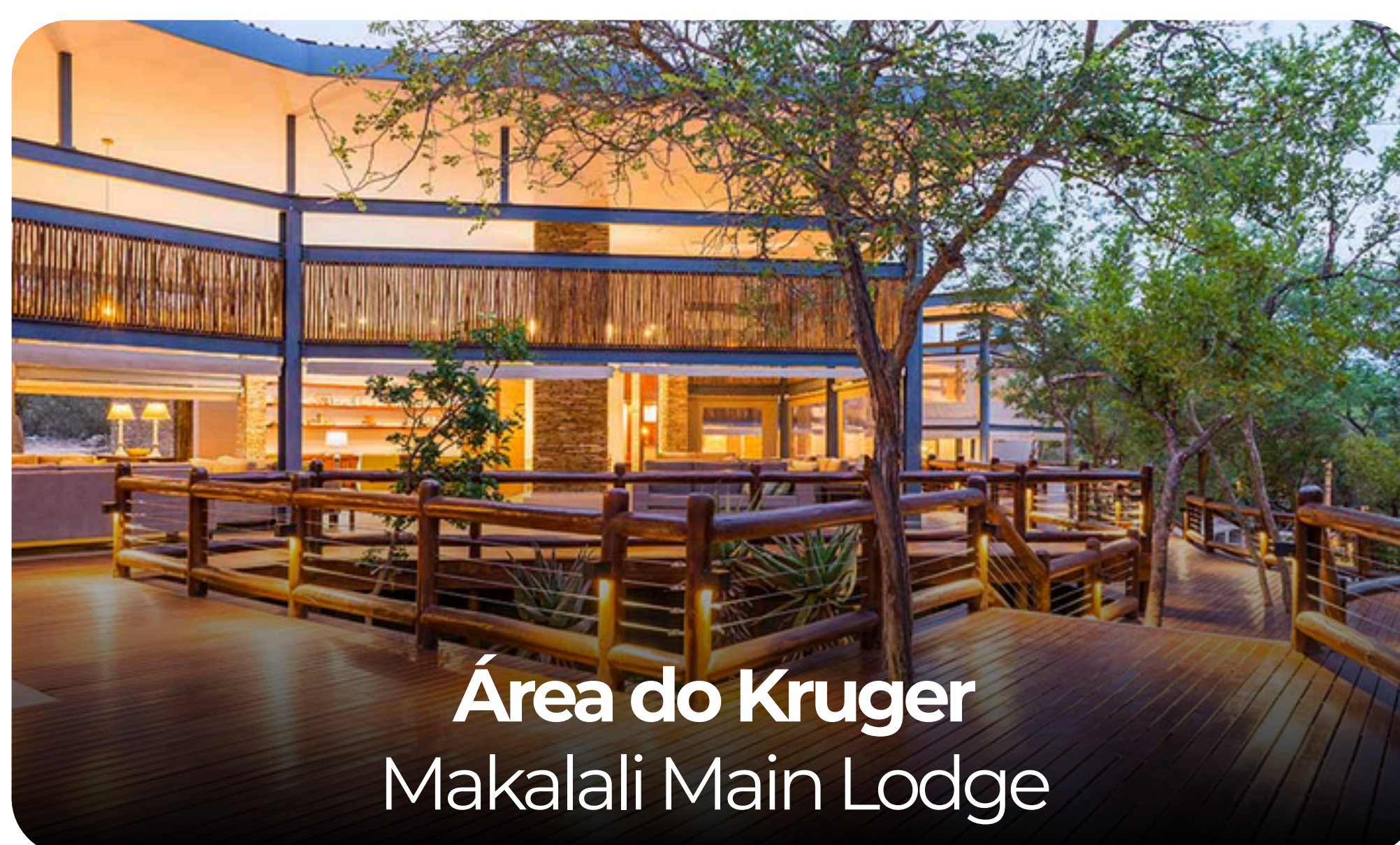
Área do Kruger Makalali Main Lodge