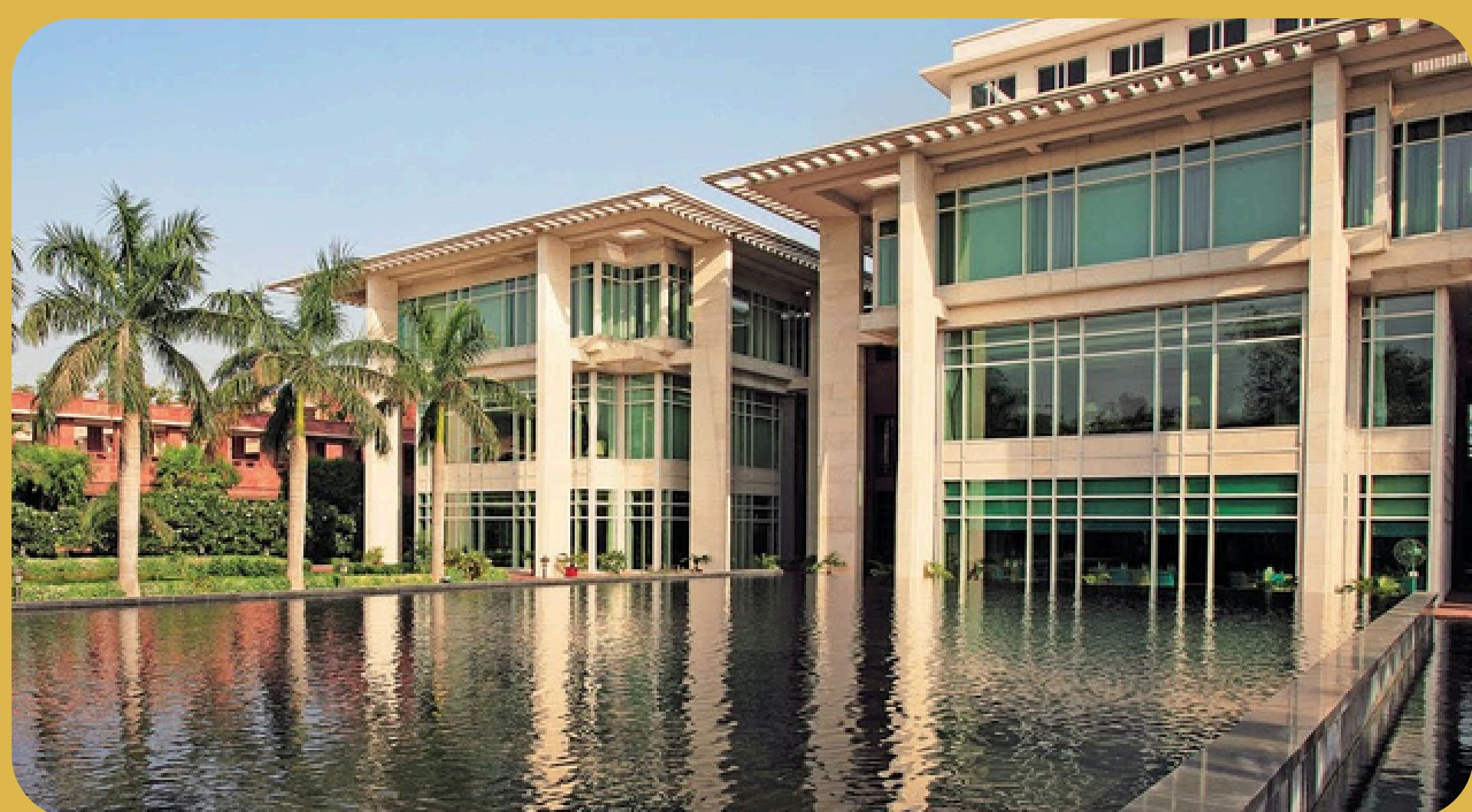
Jaypee Palace Agra