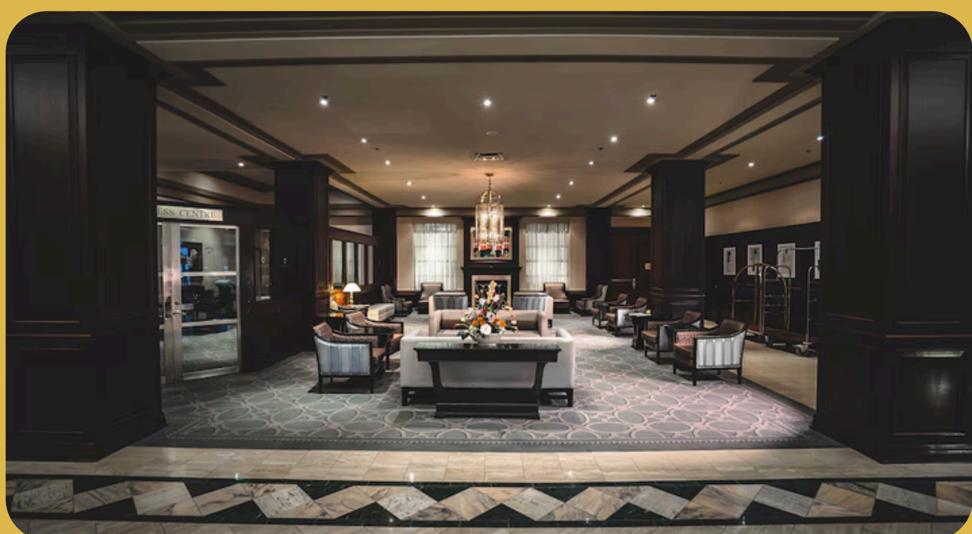
Lord Elgin Ottawa