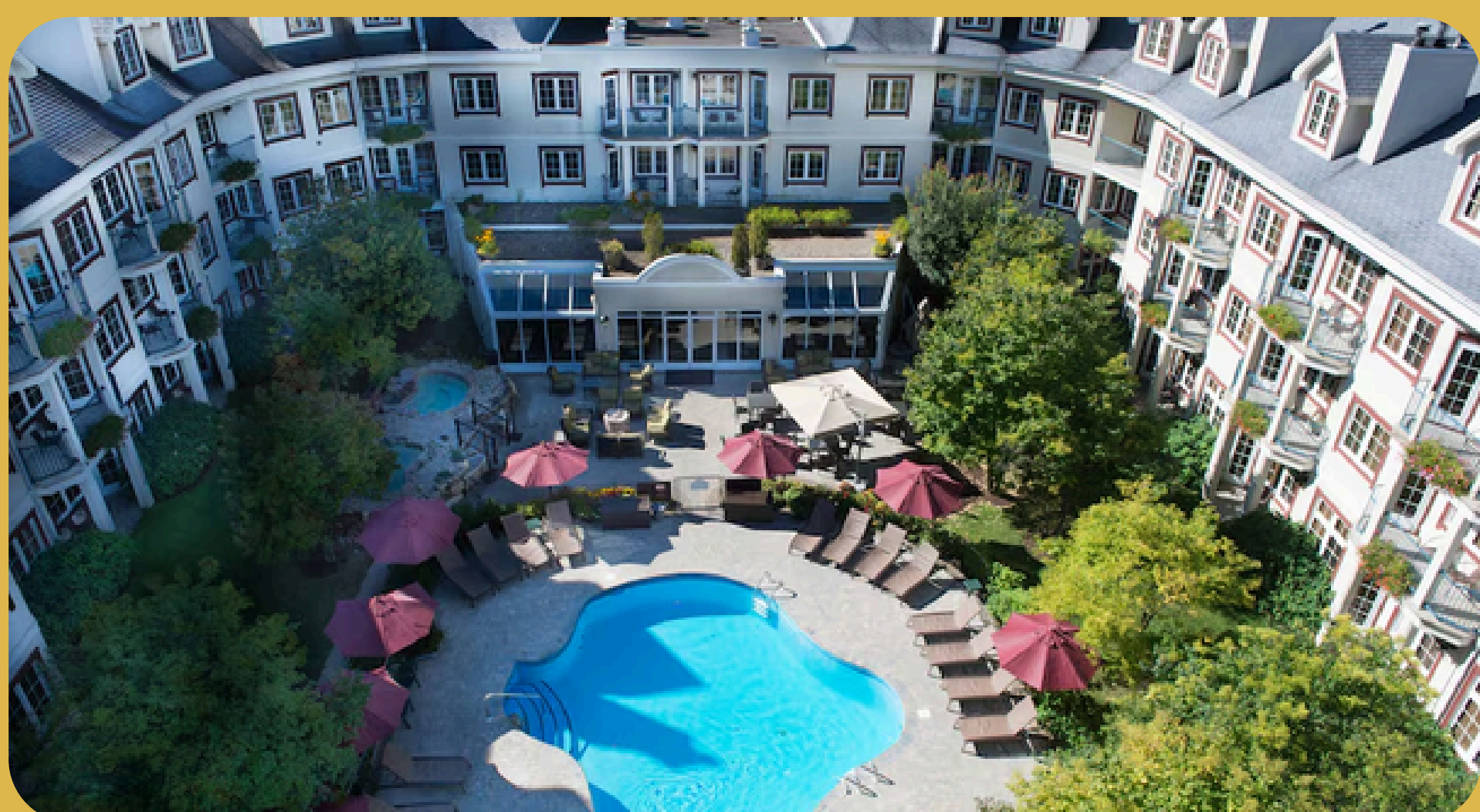
Residence Inn Tremblant Mt Tremblant