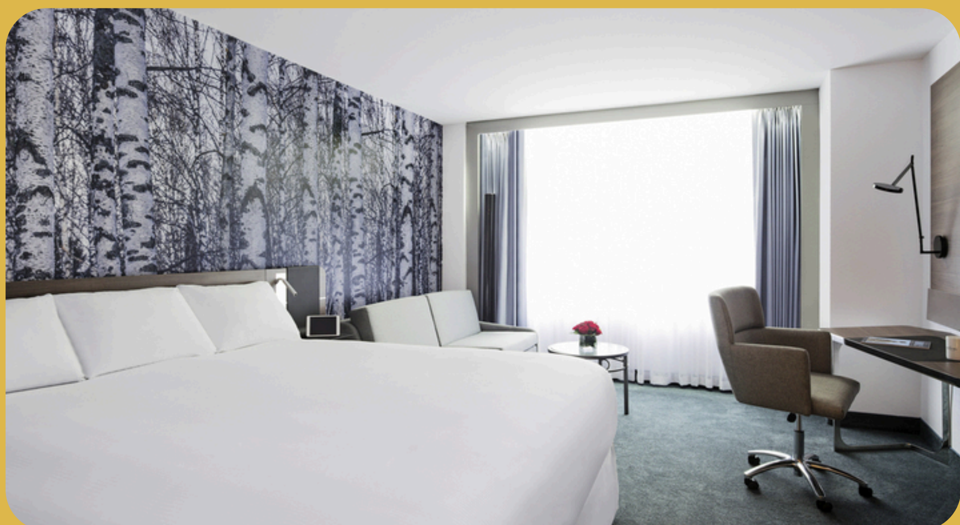
Novotel Montreal Montreal