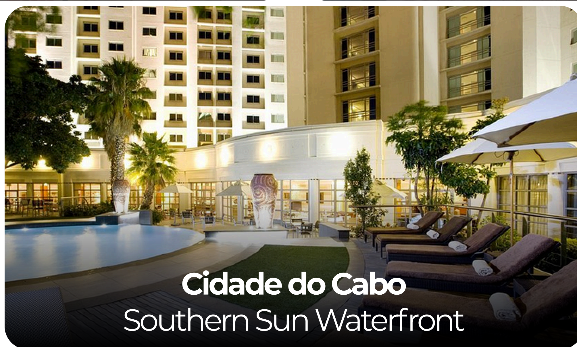
Cidade do Cabo Southern Sun Waterfront