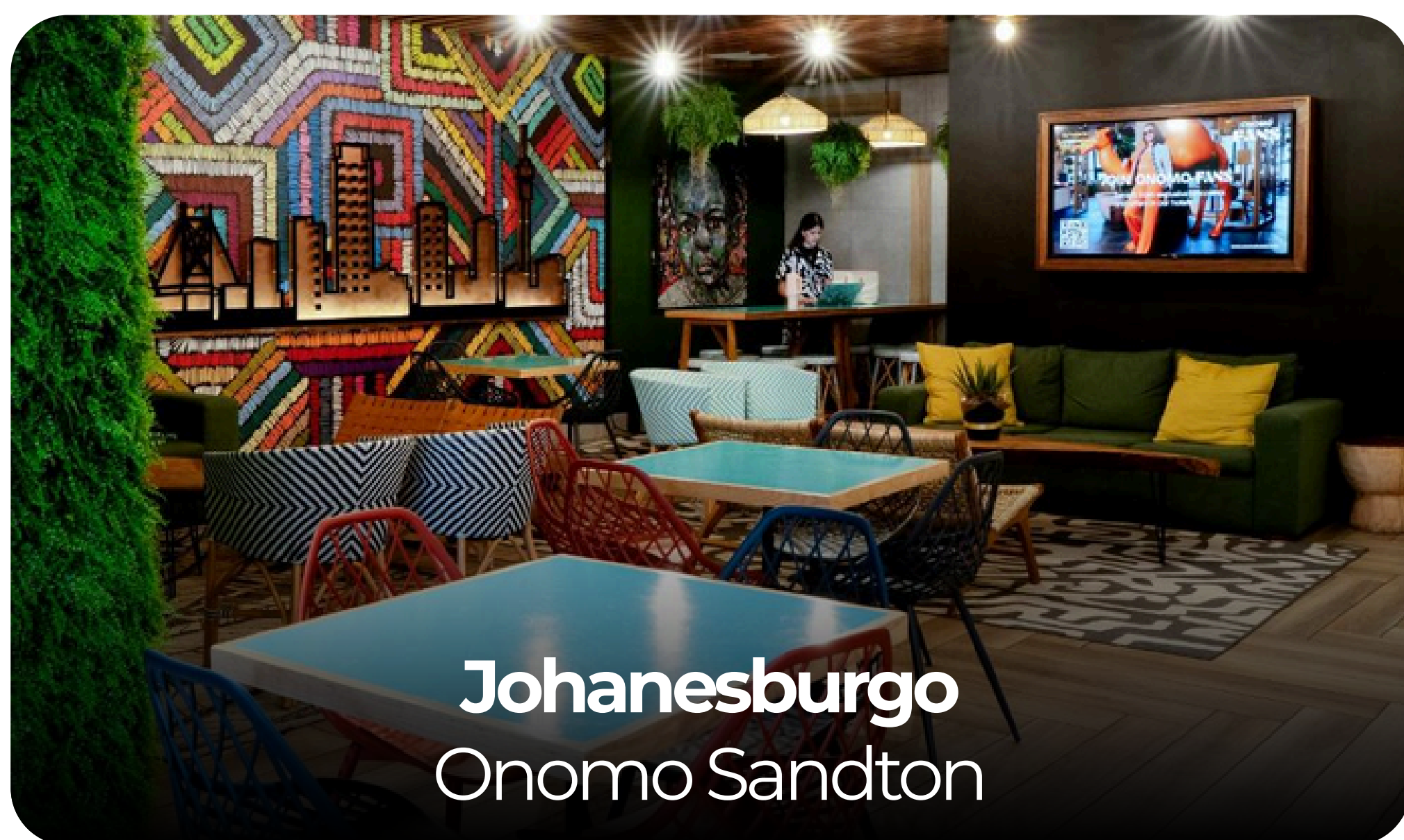
Johanesburgo Onomo Sandton