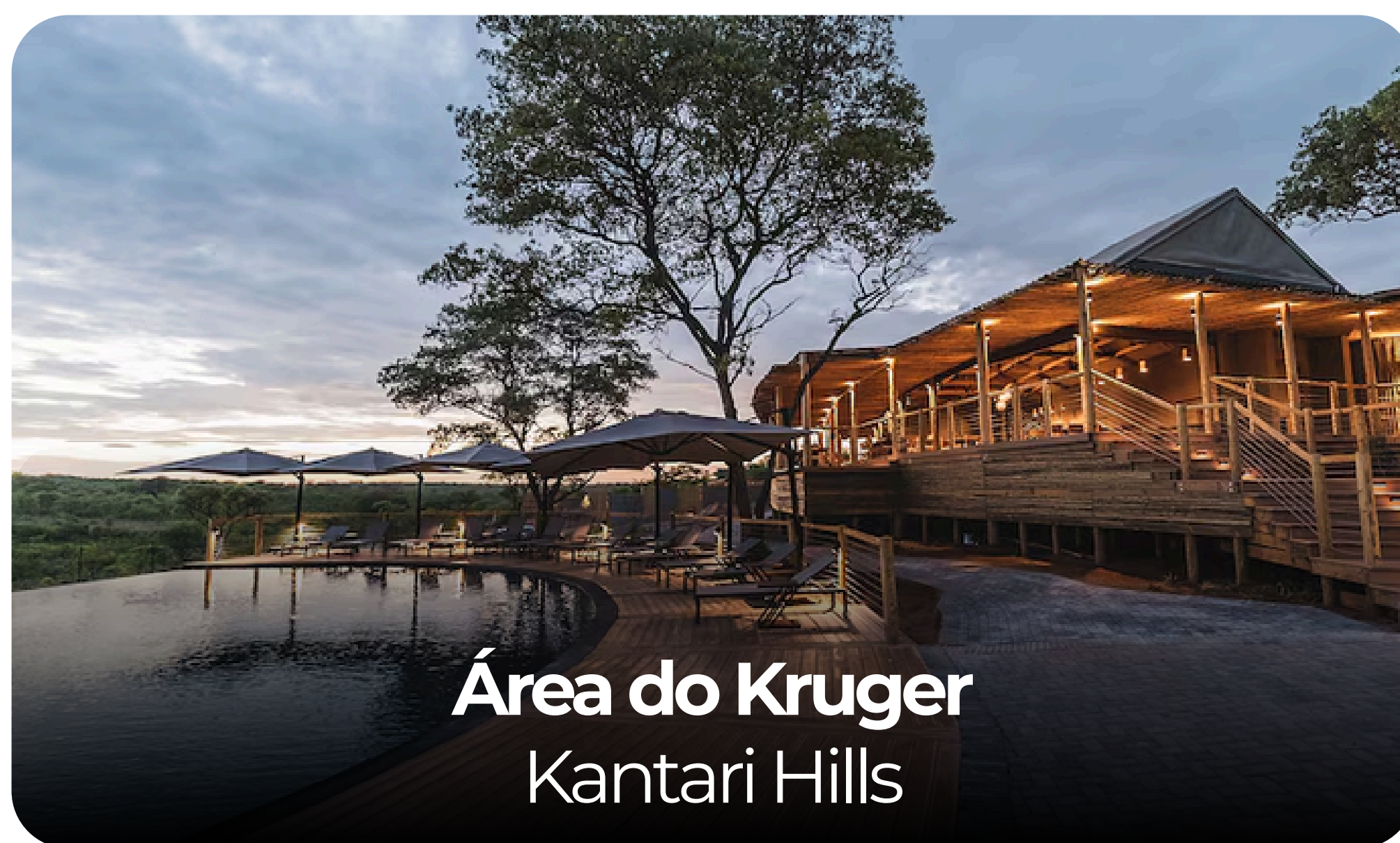
Área do Kruger Kantari Hills