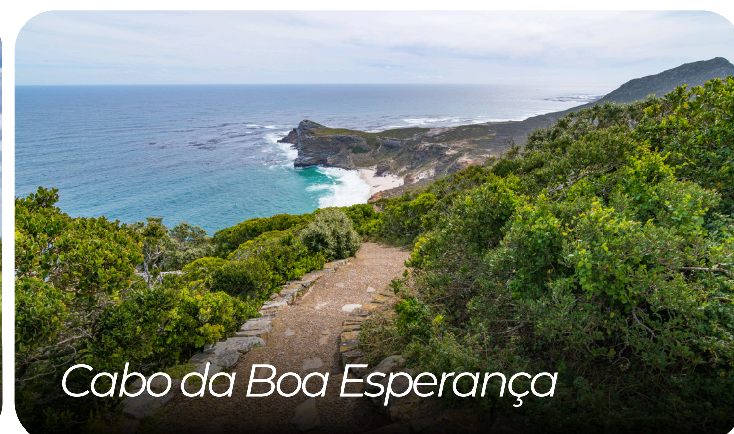
Cabo da Boa Esperança