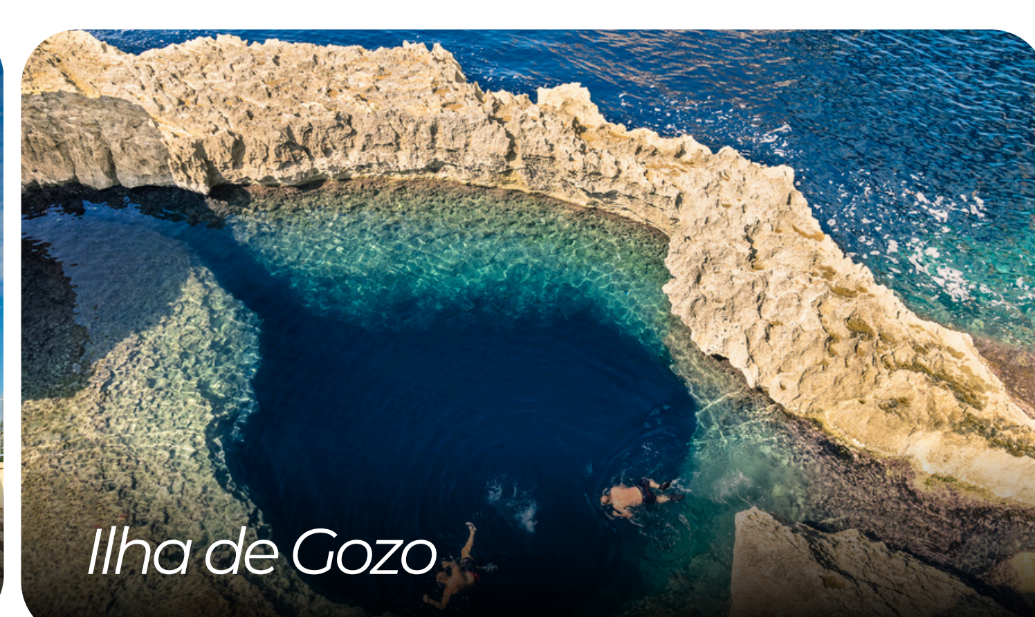
Ilha de Gozo