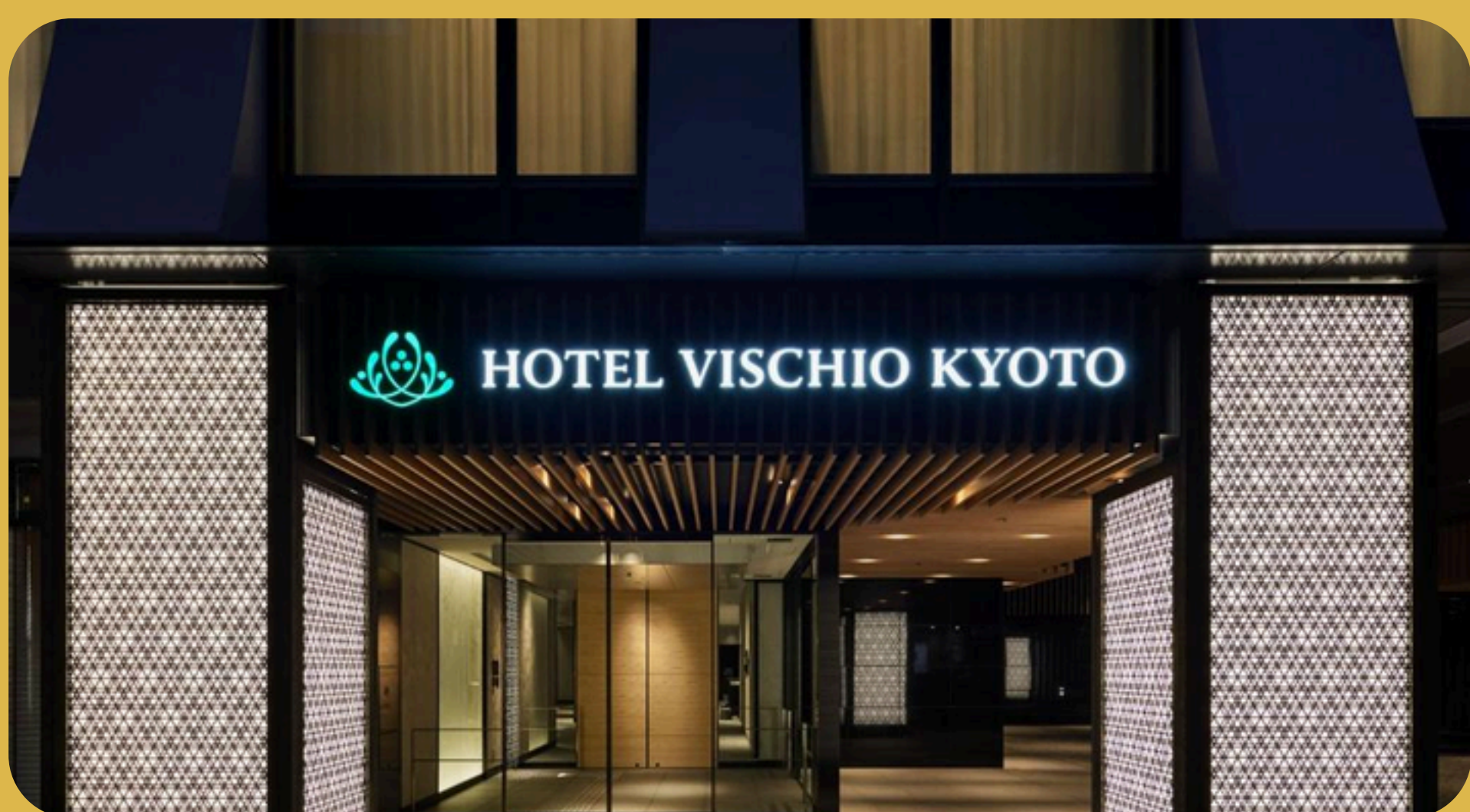
Hotel Vischio Kyoto Quioto