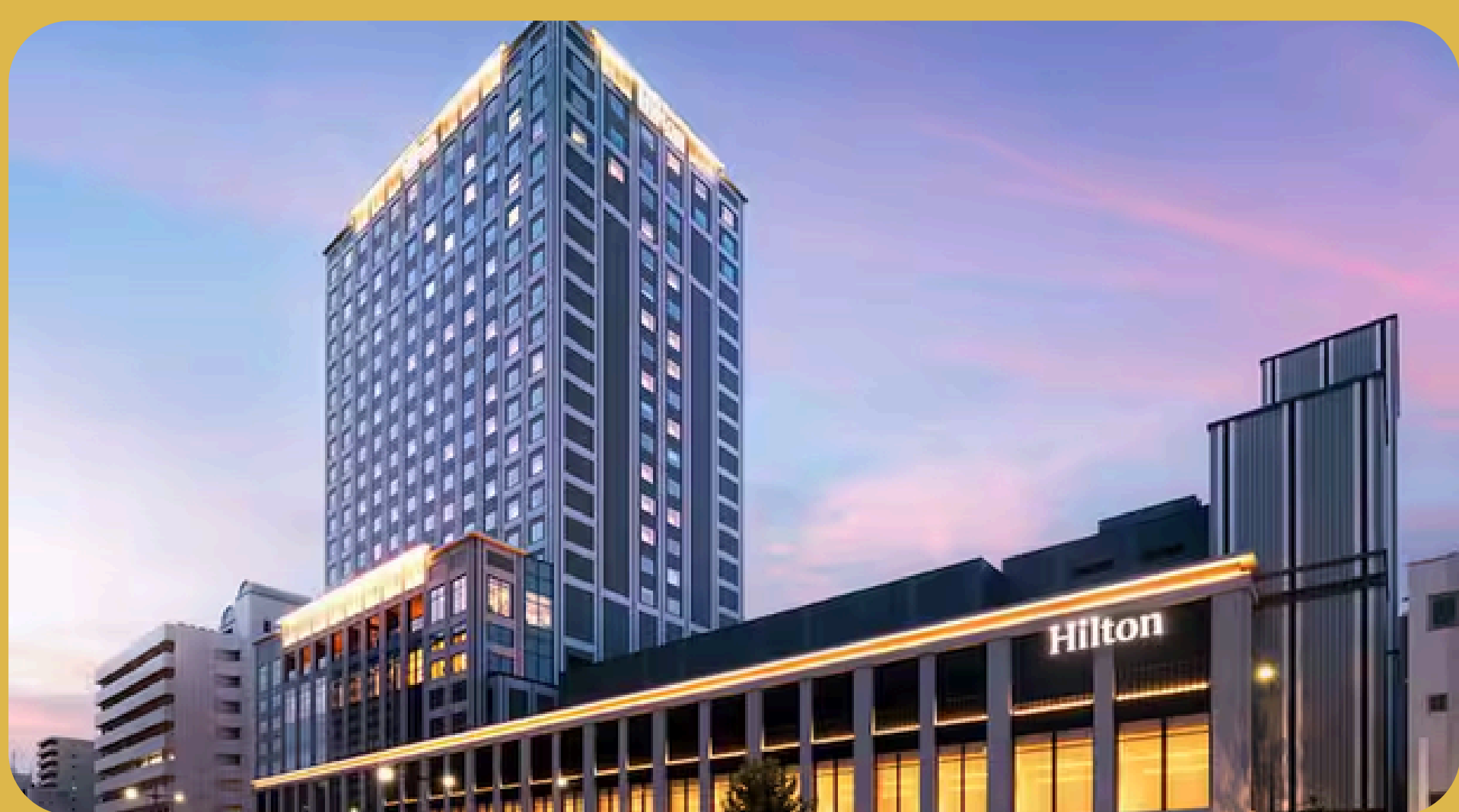
Hilton Hiroshima Hiroshima