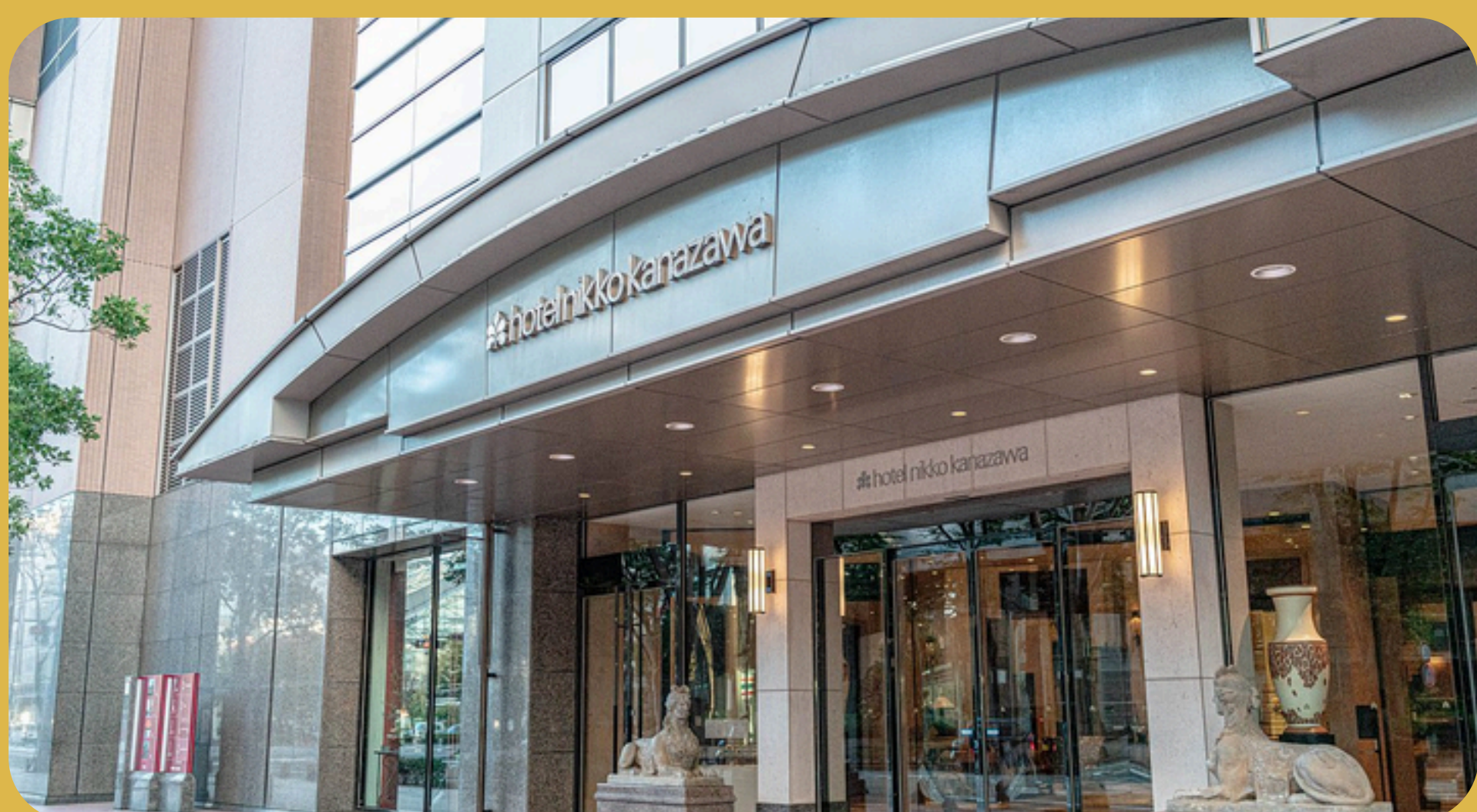
Hotel Nikko Kanazawa Kanazawa