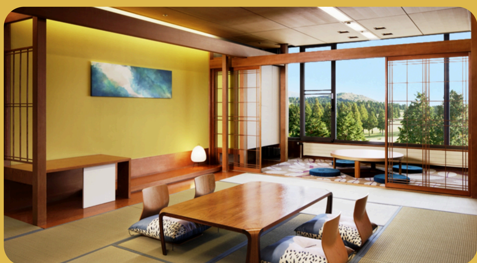
Yunohana Prince Hotel Hakone