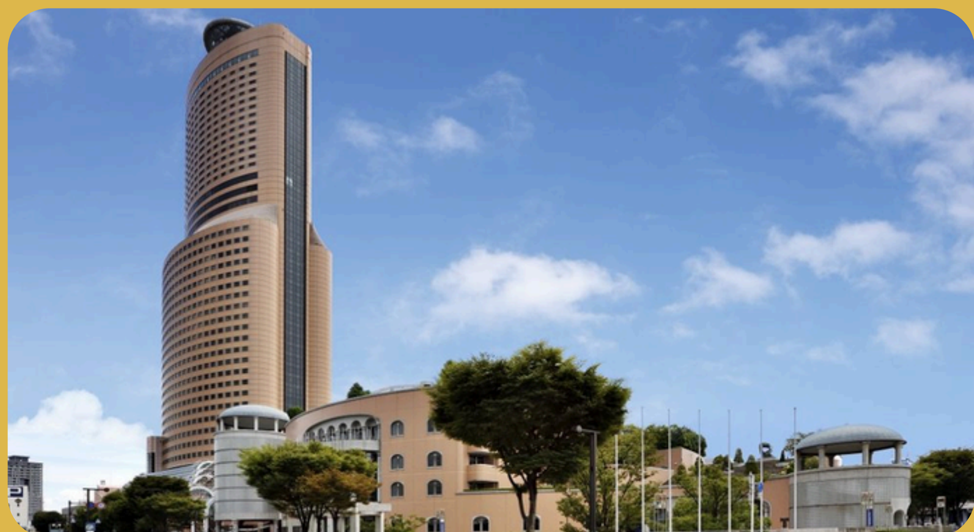
Okura Act City Hotel Hamamatsu Hamamatsu