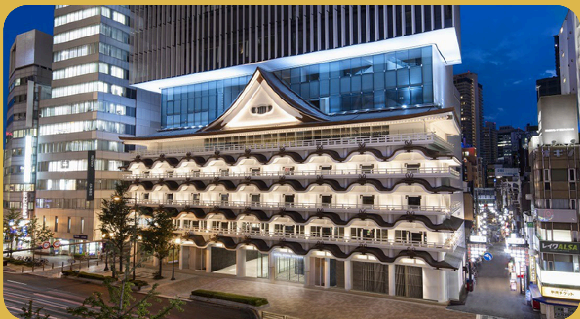
Hotel Royal Classic Osaka Osaka