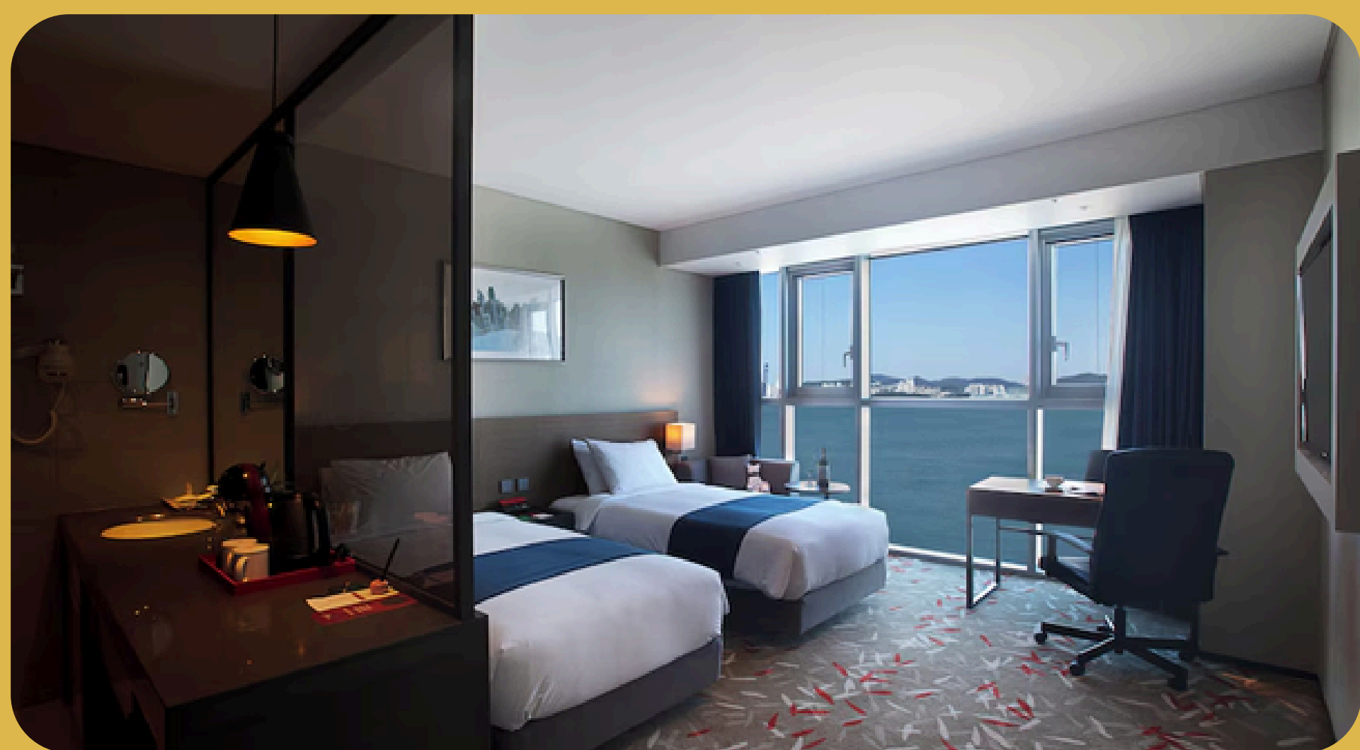
Asti Hotel Busan Busan