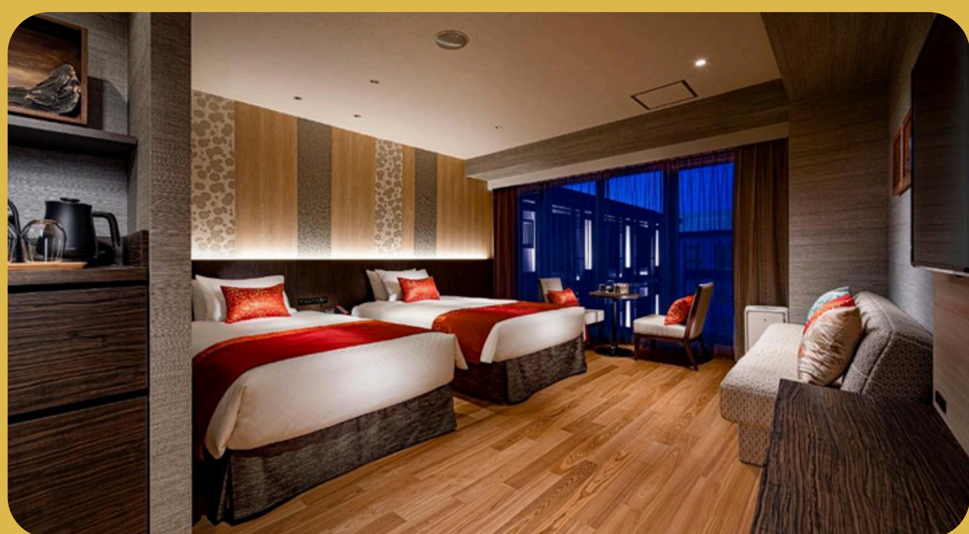
Rihga Grand Kyoto Quioto