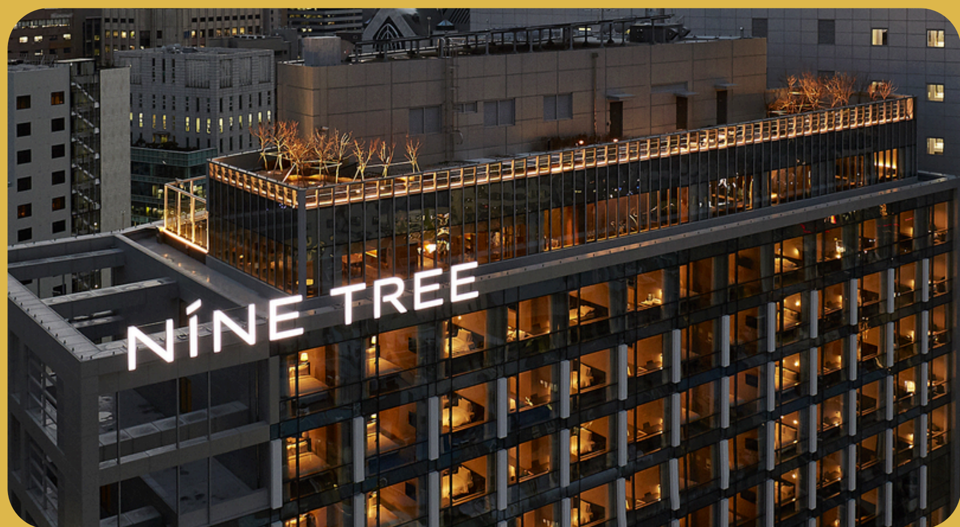
Nine Tree Premier Hotel Myeongdong II Seul