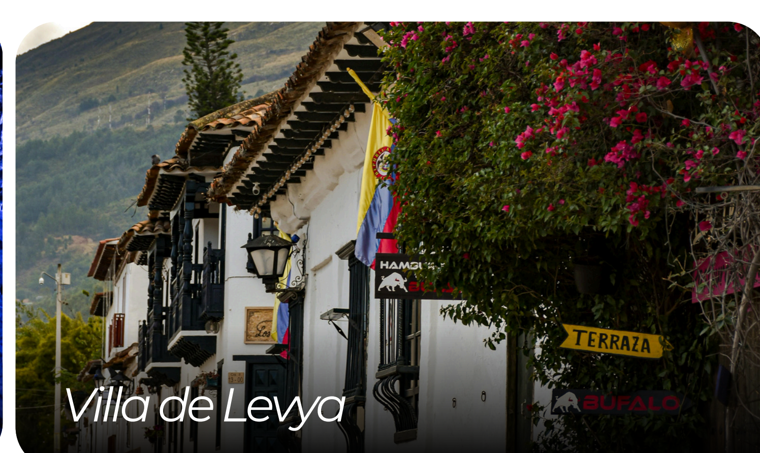
Villa de Leyva