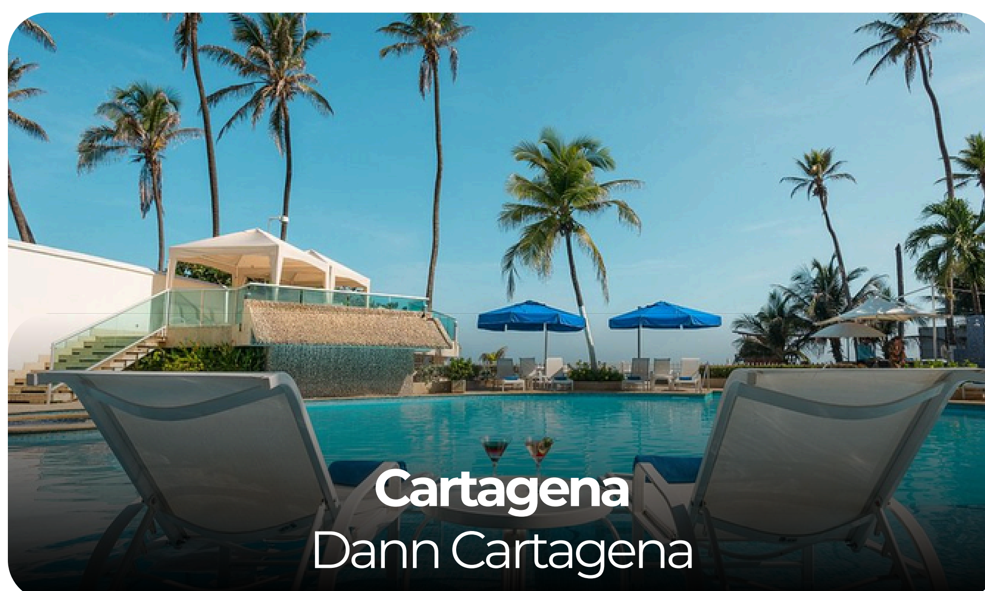
Cartagena Dann Cartagena