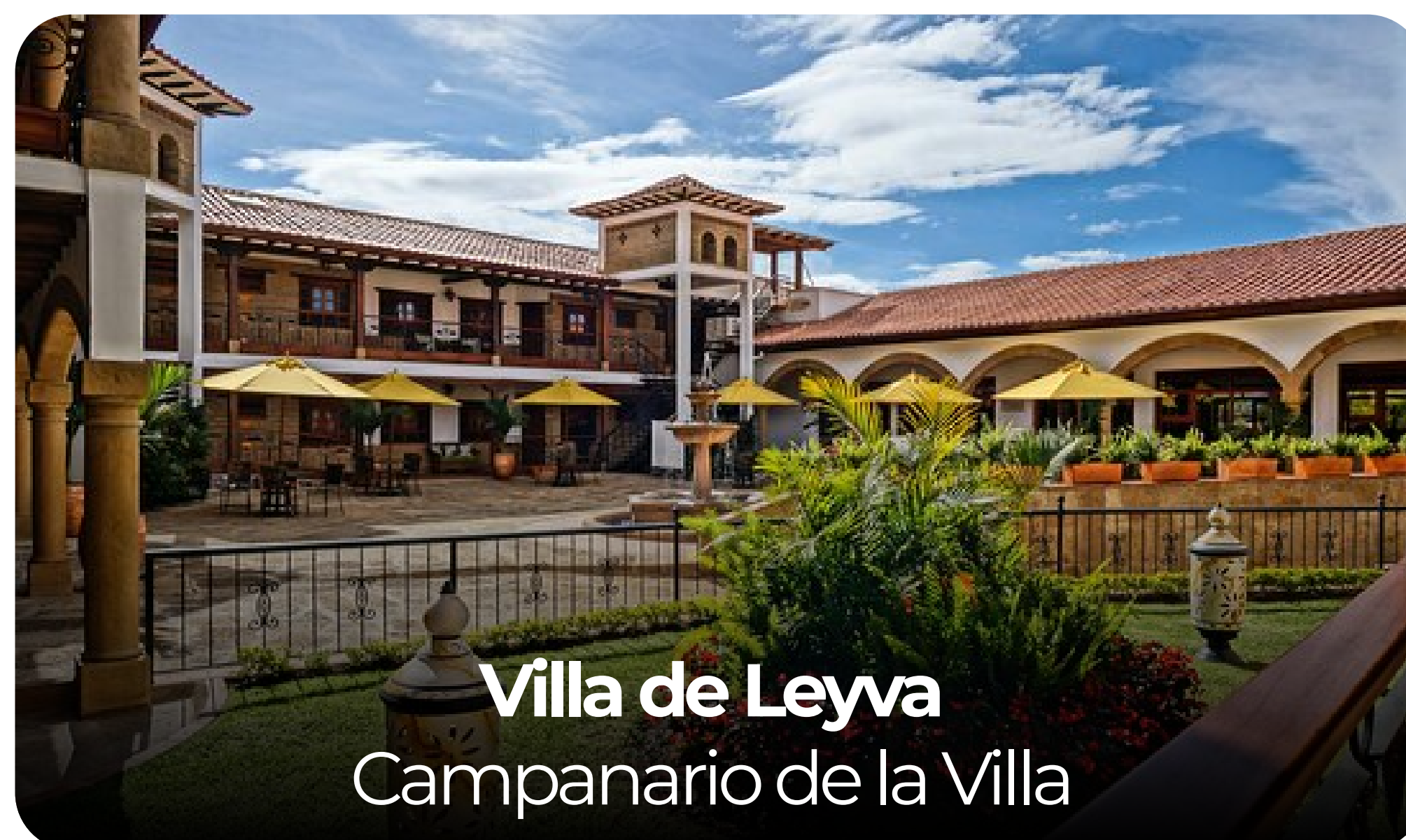
Villa de Leyva Campanario de la Villa