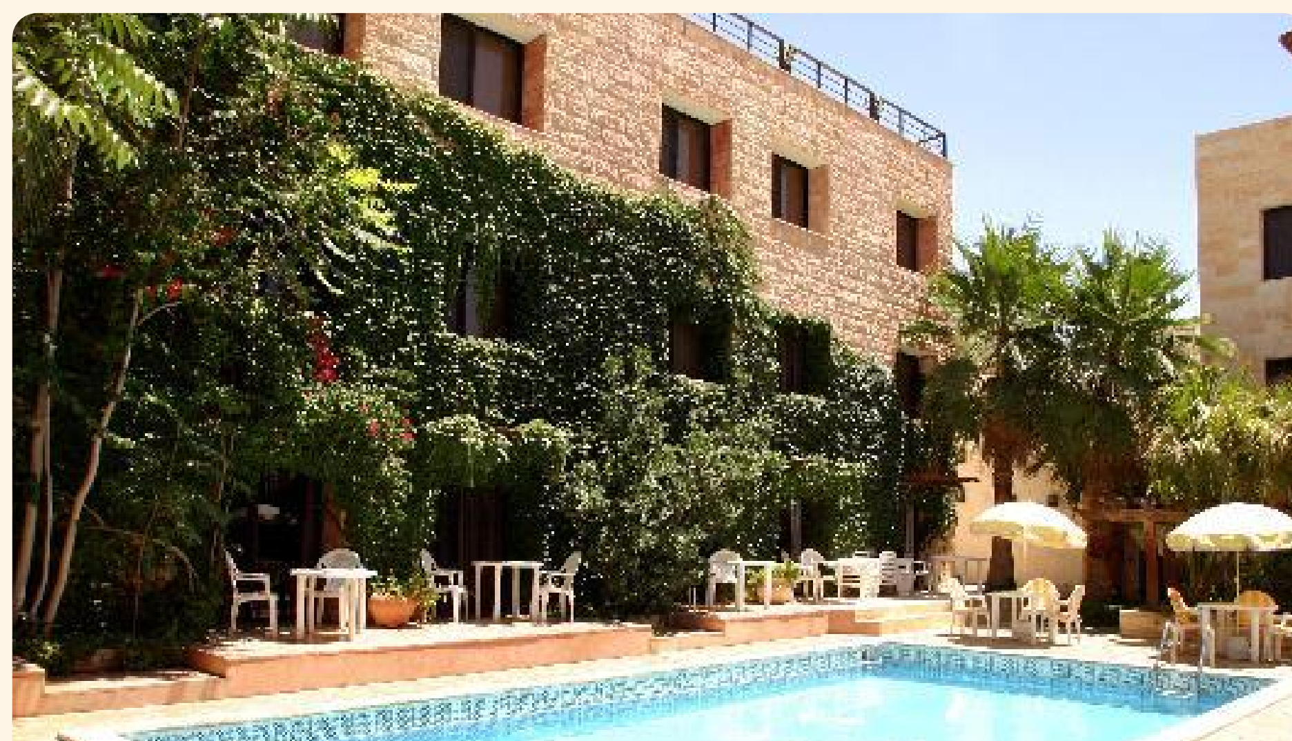
Petra Petra Palace