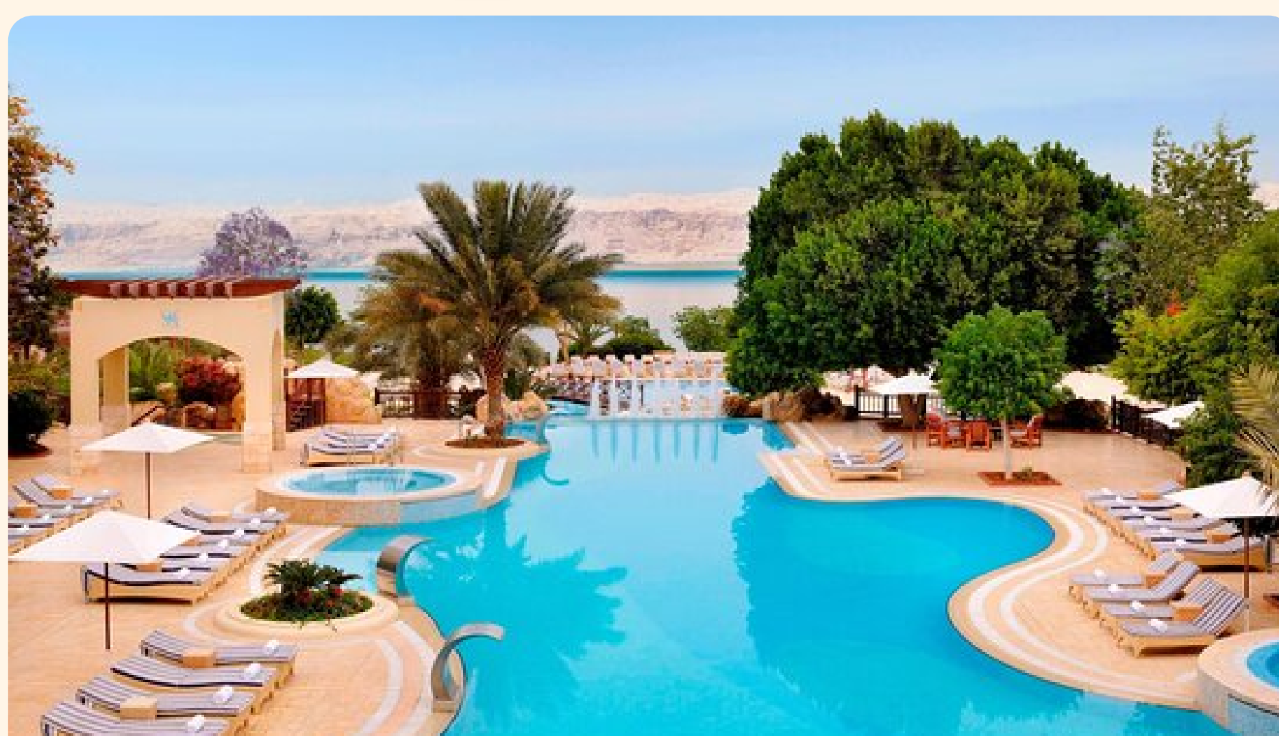
Mar Morto Dead Sea Marriott Resort