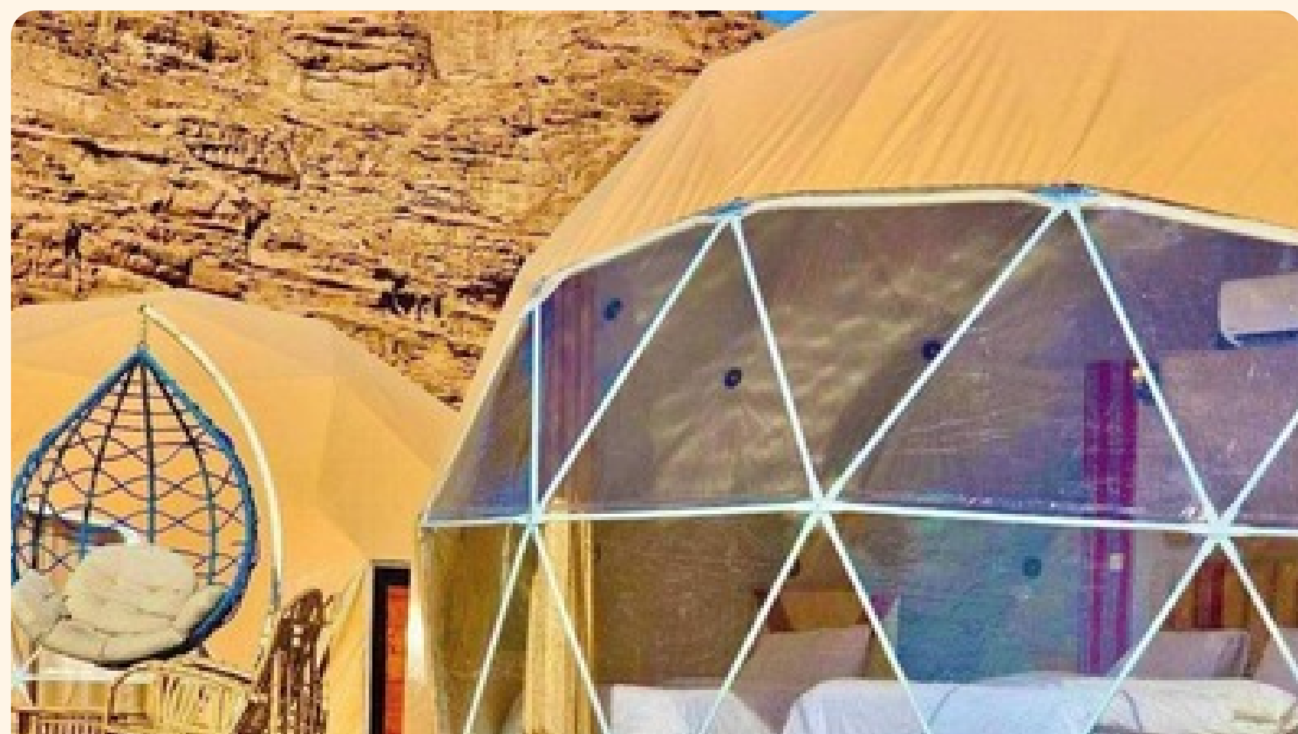
Wadi Rum Ataya Sunrise Camp