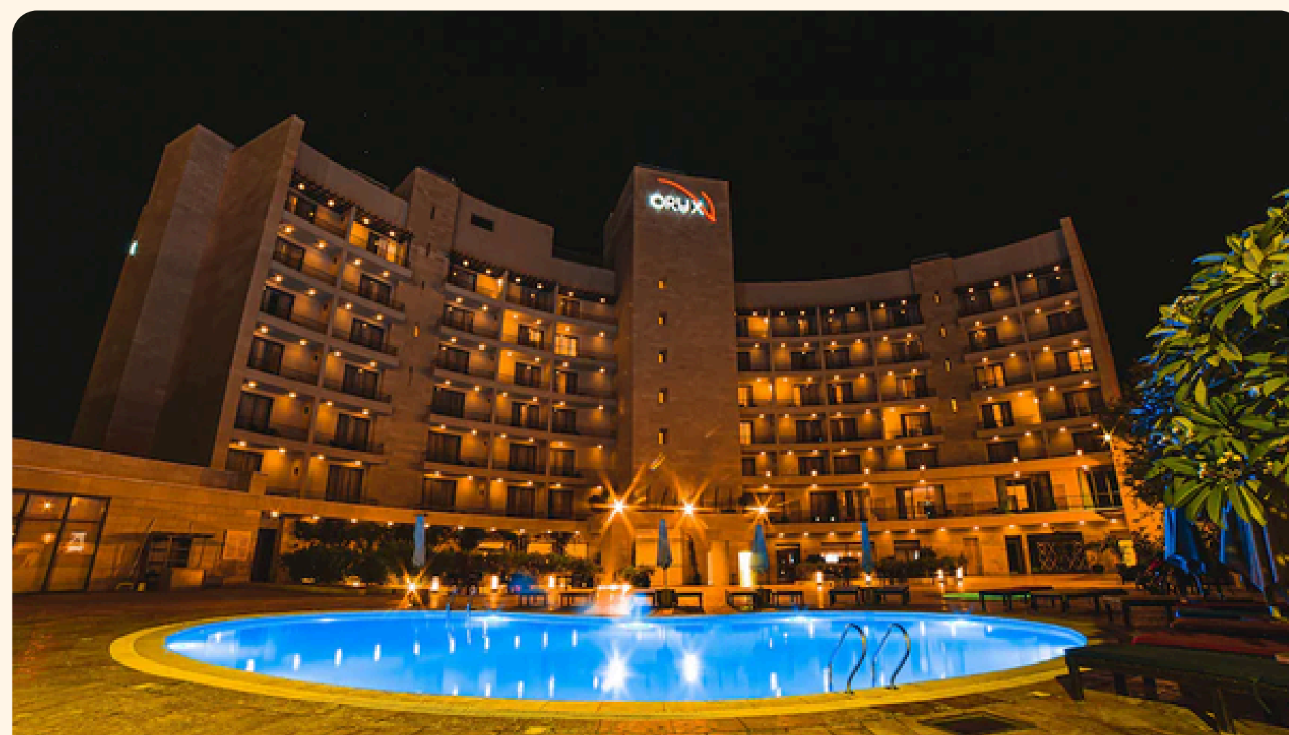
Aqaba Oryx Aqaba