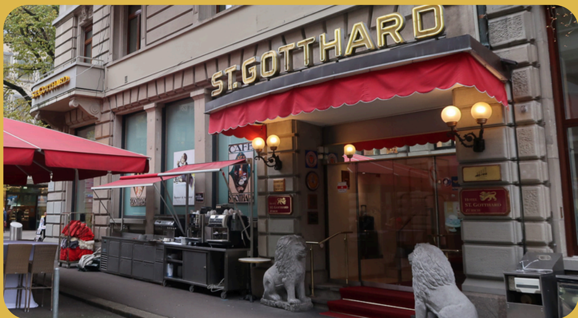
St. Gotthard Zurich