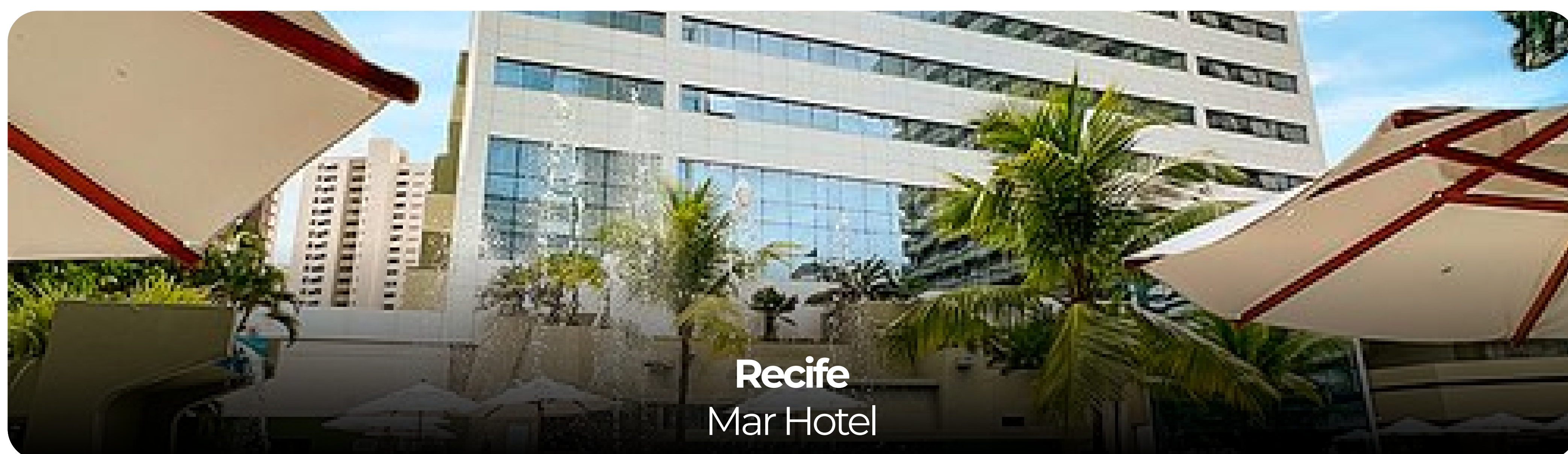
Recife Mar Hotel