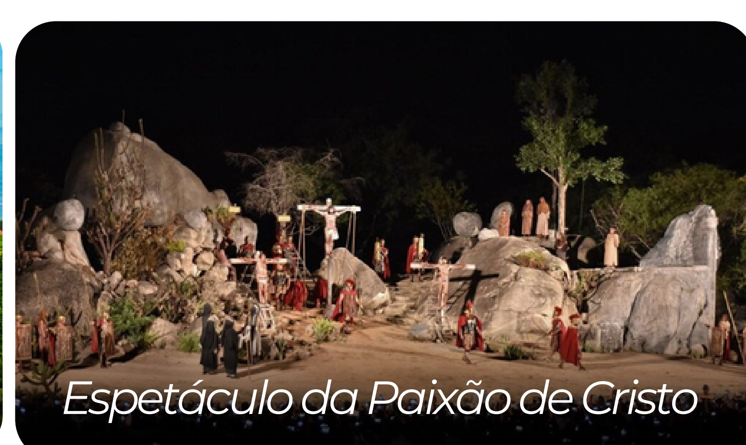
Espectáculo da Paixão de Cristo