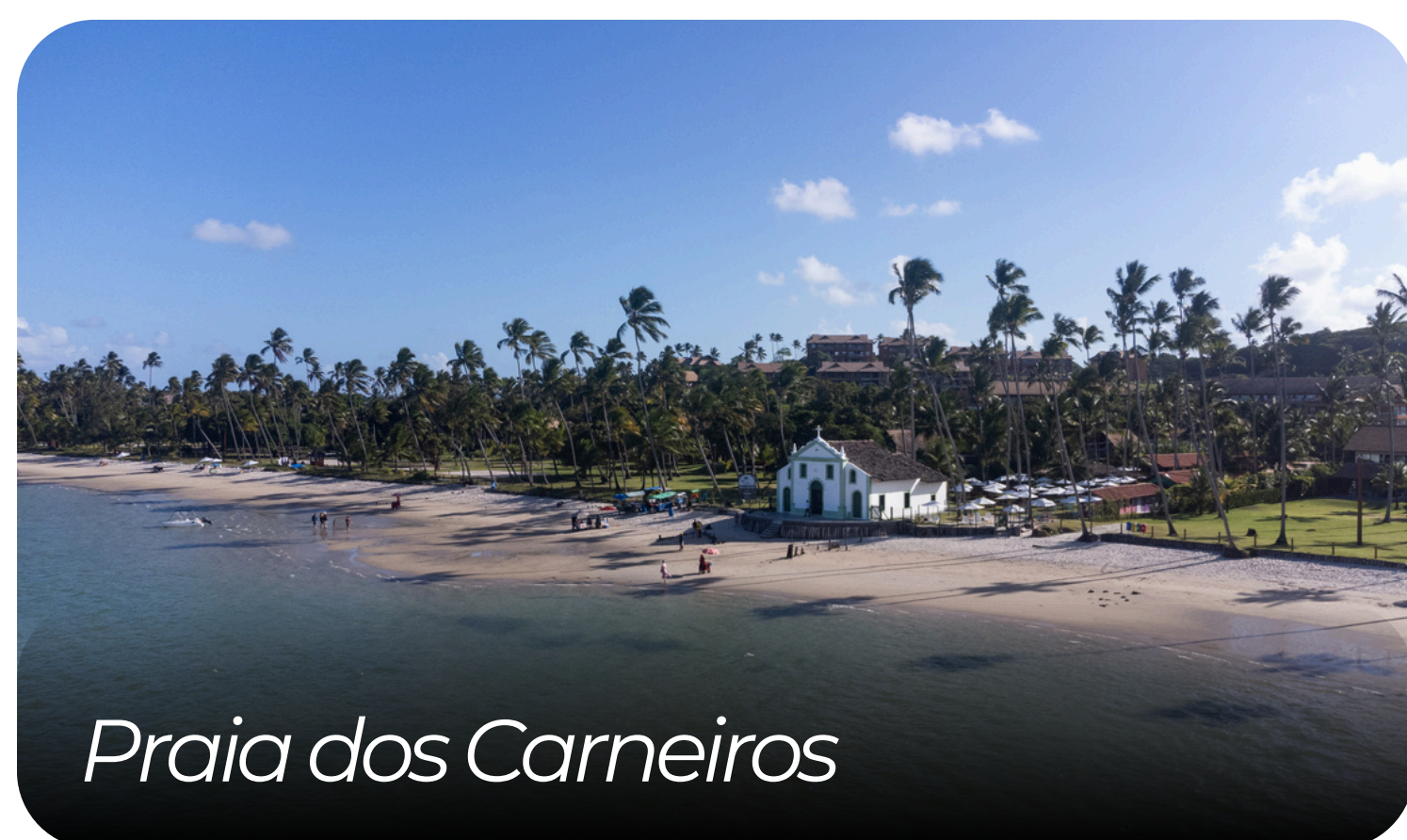
Praia dos Carneiros