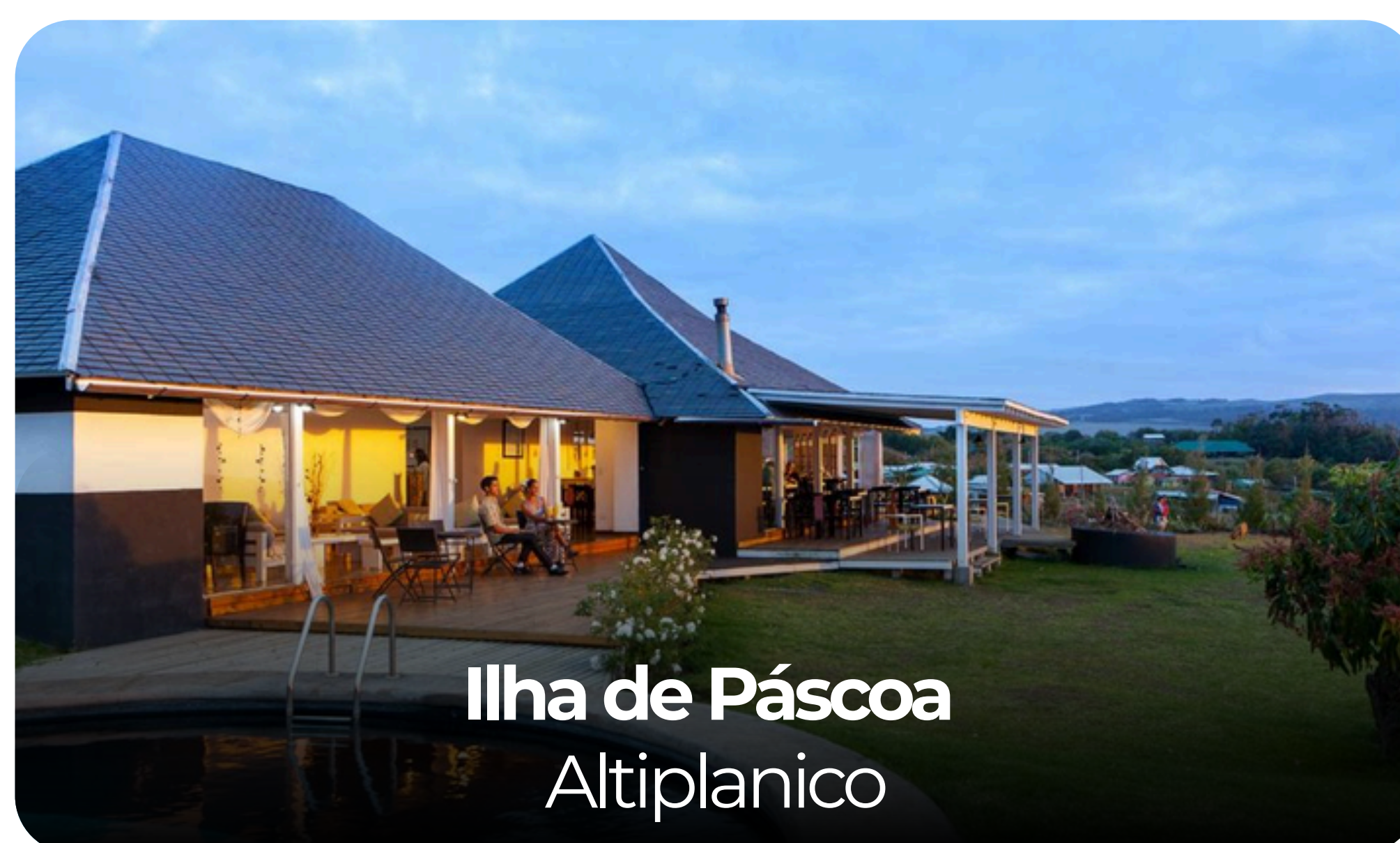
Ilha de Páscoa Altiplanico