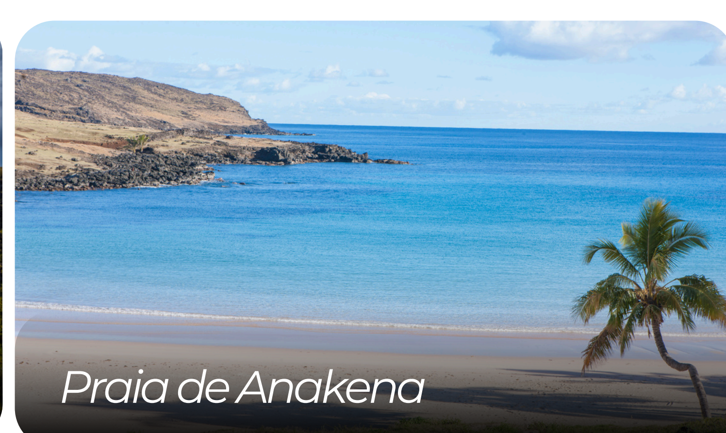
Praia de Anakena