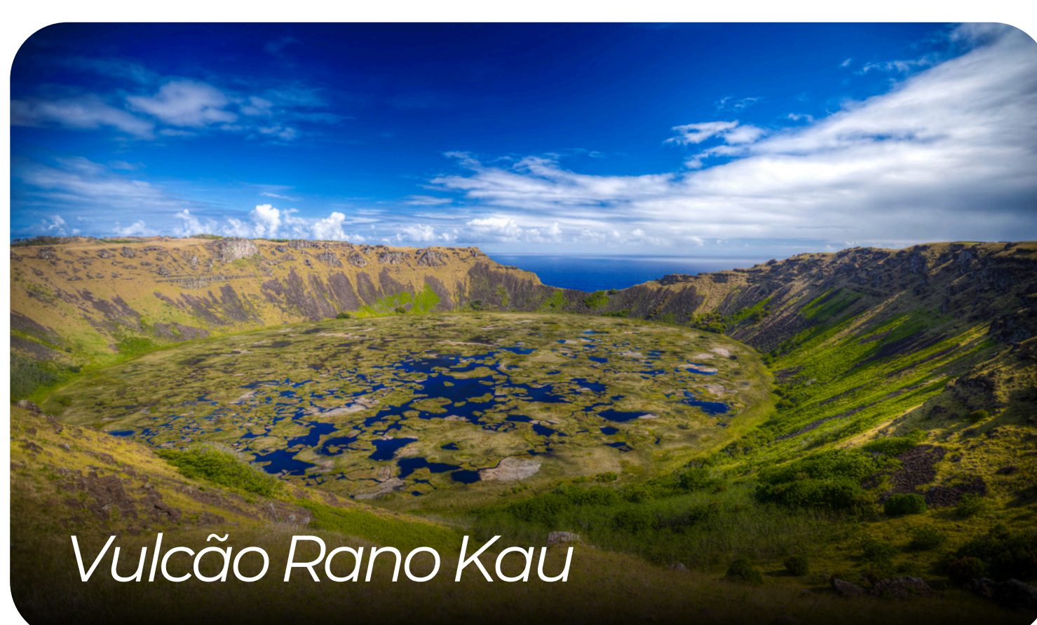
Vulcão Rano Kau