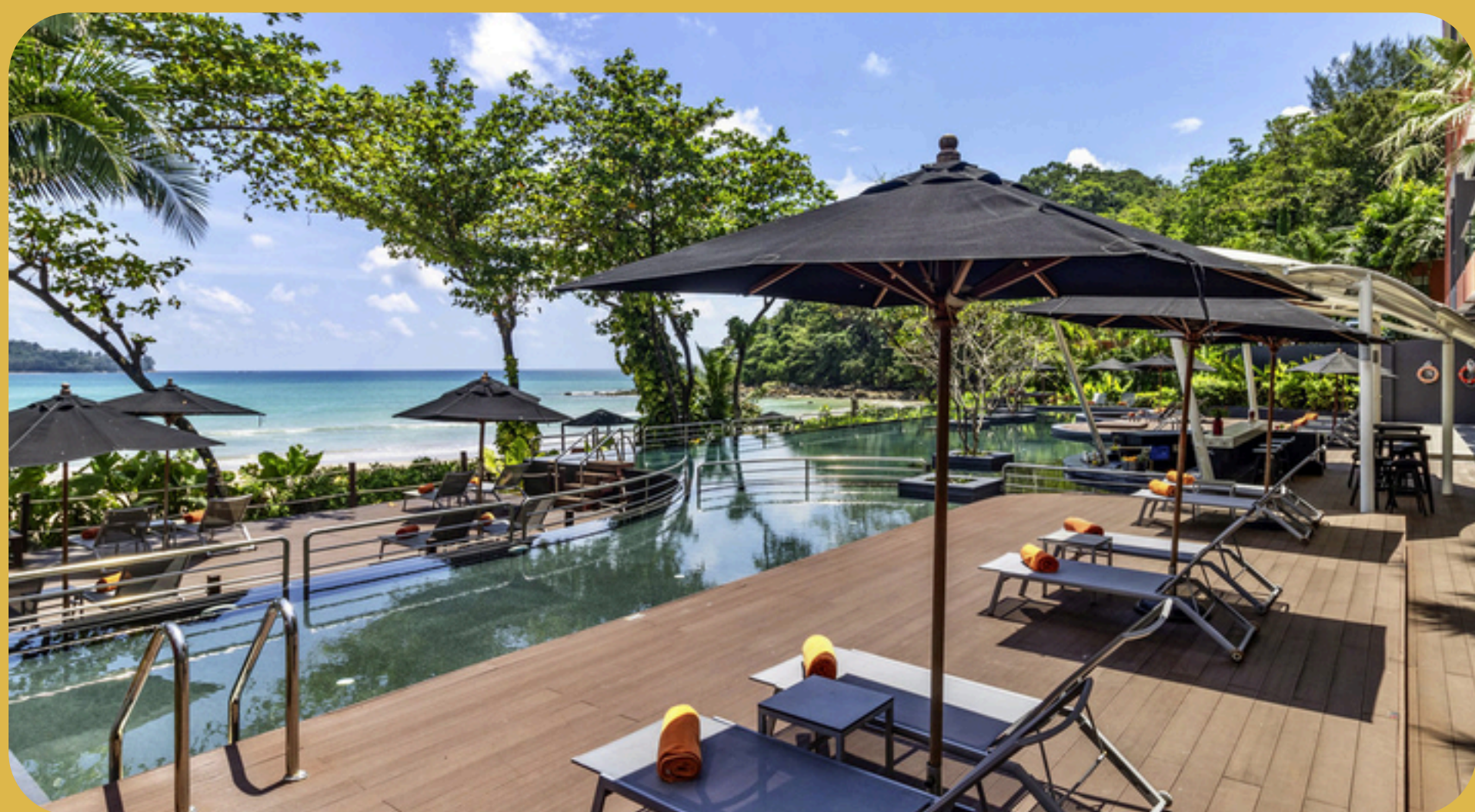
Novotel Kamala Phuket