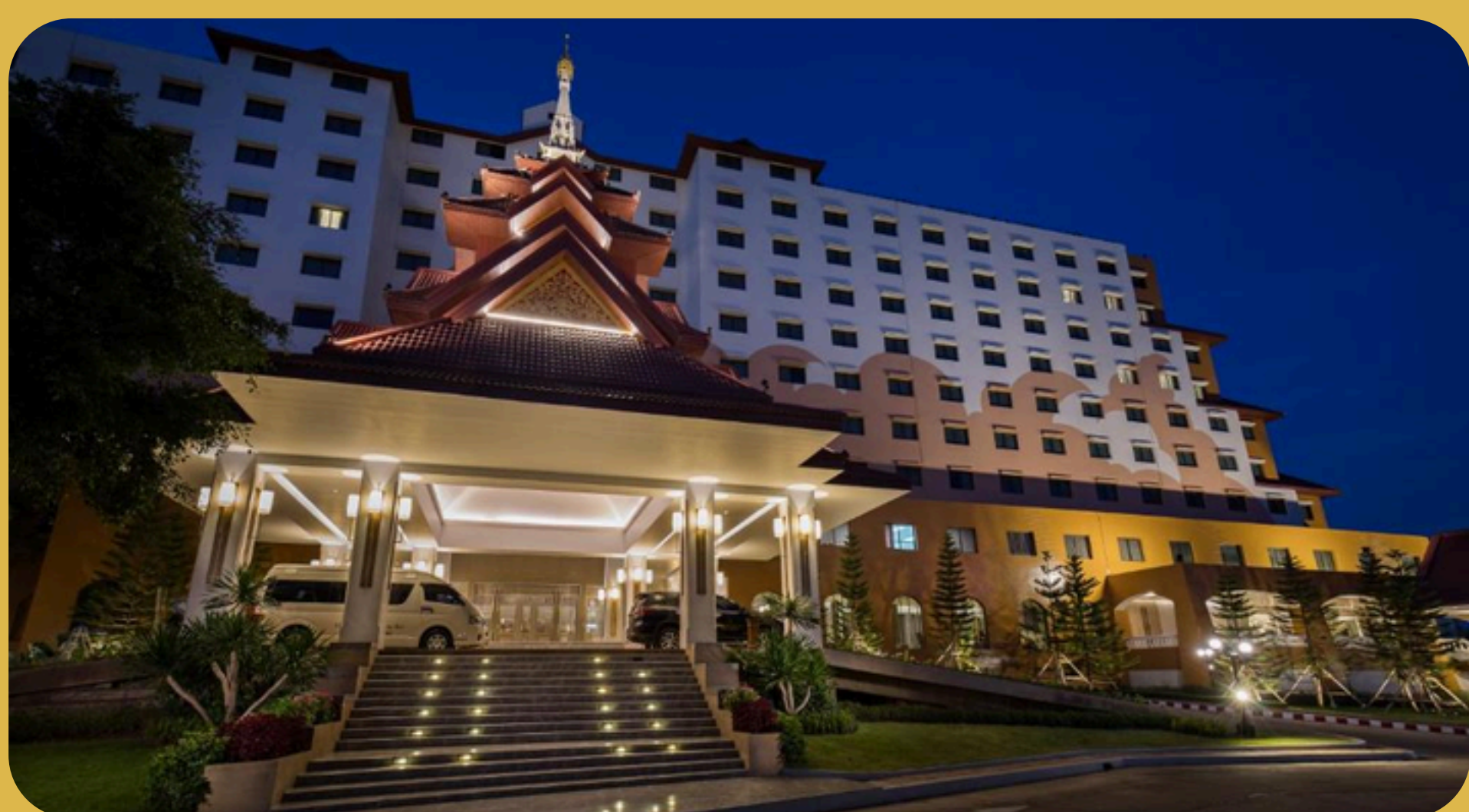
The Heritage Chiang Rai