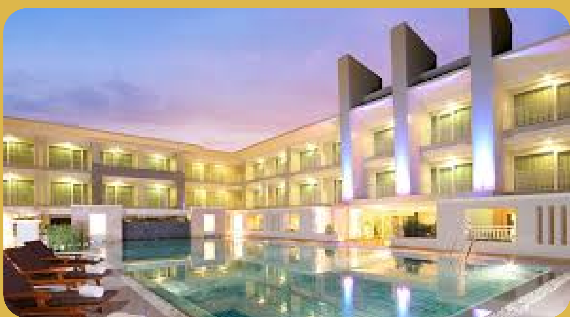
Kantari Hills Chiang Mai