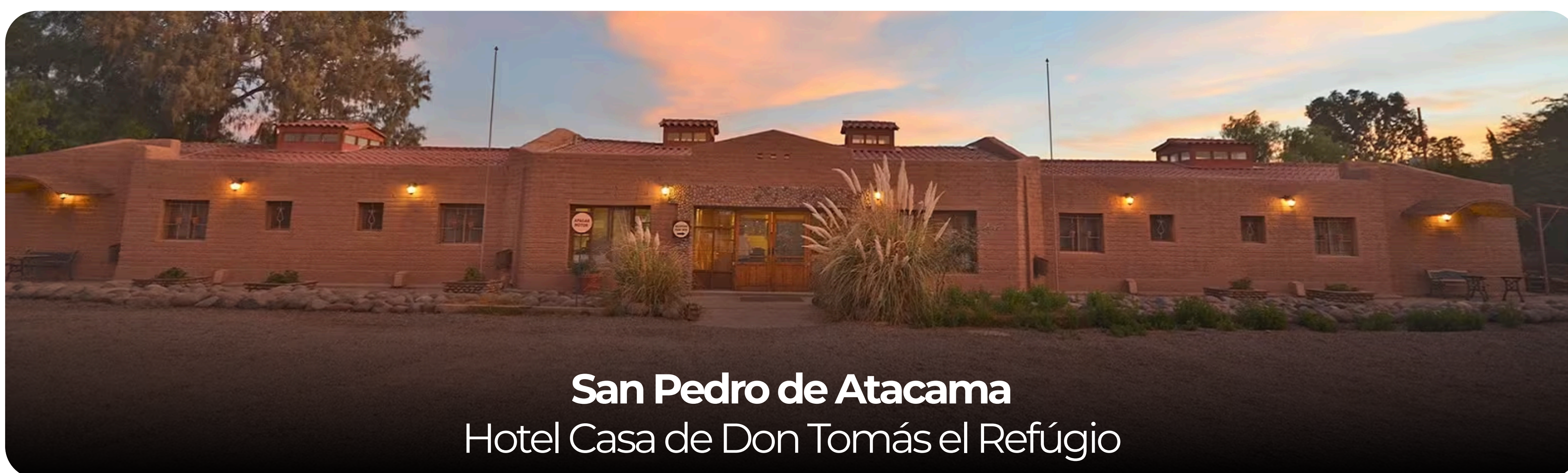
San Pedro de Atacama Hotel Casa de Don Tomás el Refugio