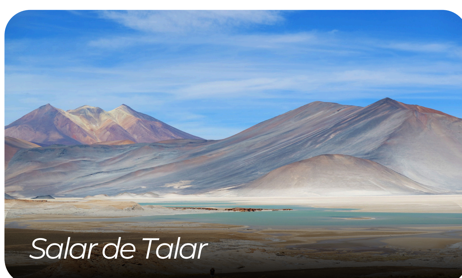
Salar de Talar