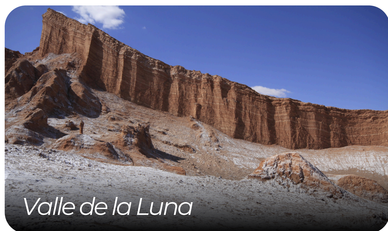
Valle de la Luna