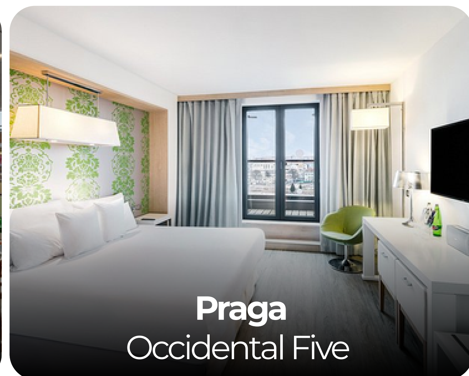
Praga Occidental Five