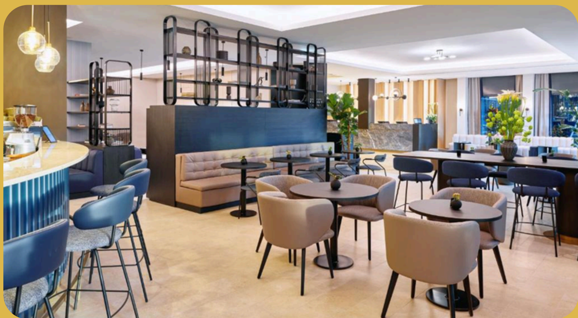
Maistra City Vibes International Zagreb