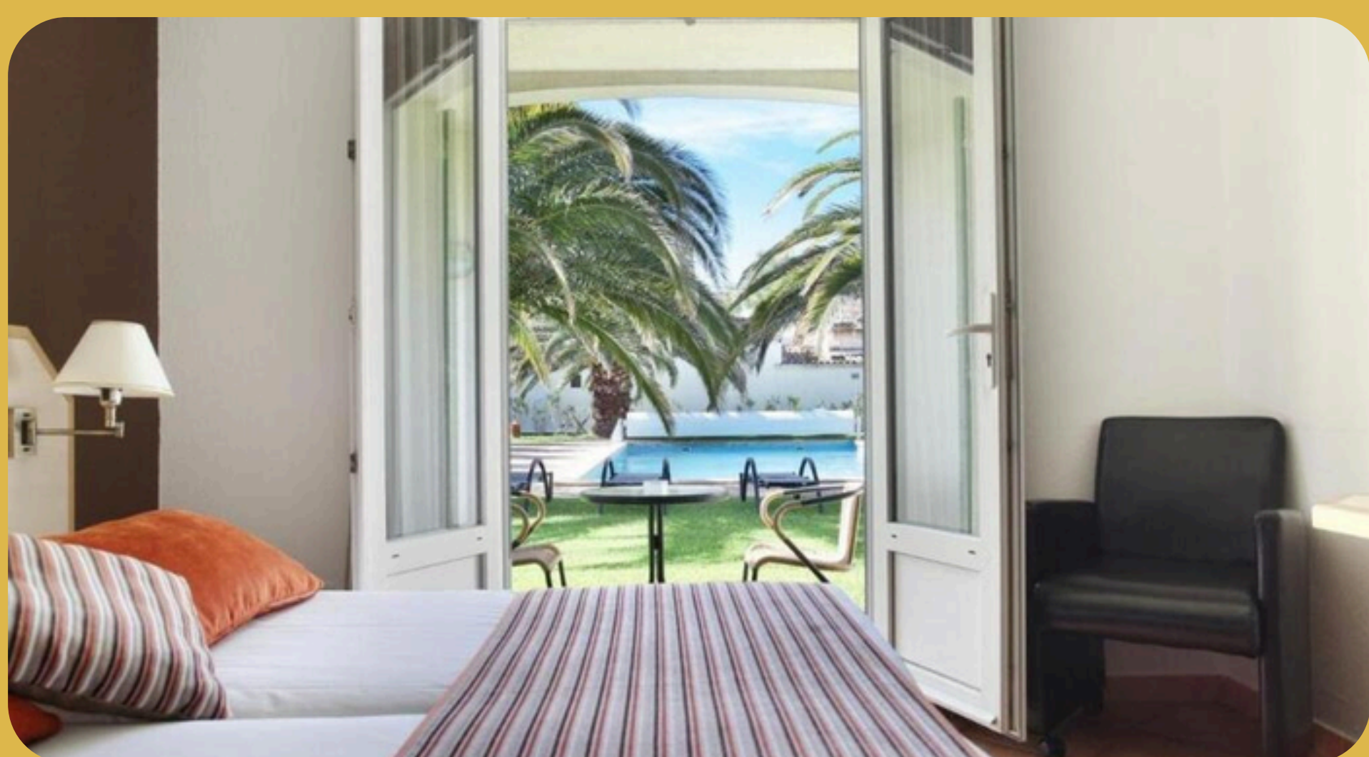
Le Rodin Arles