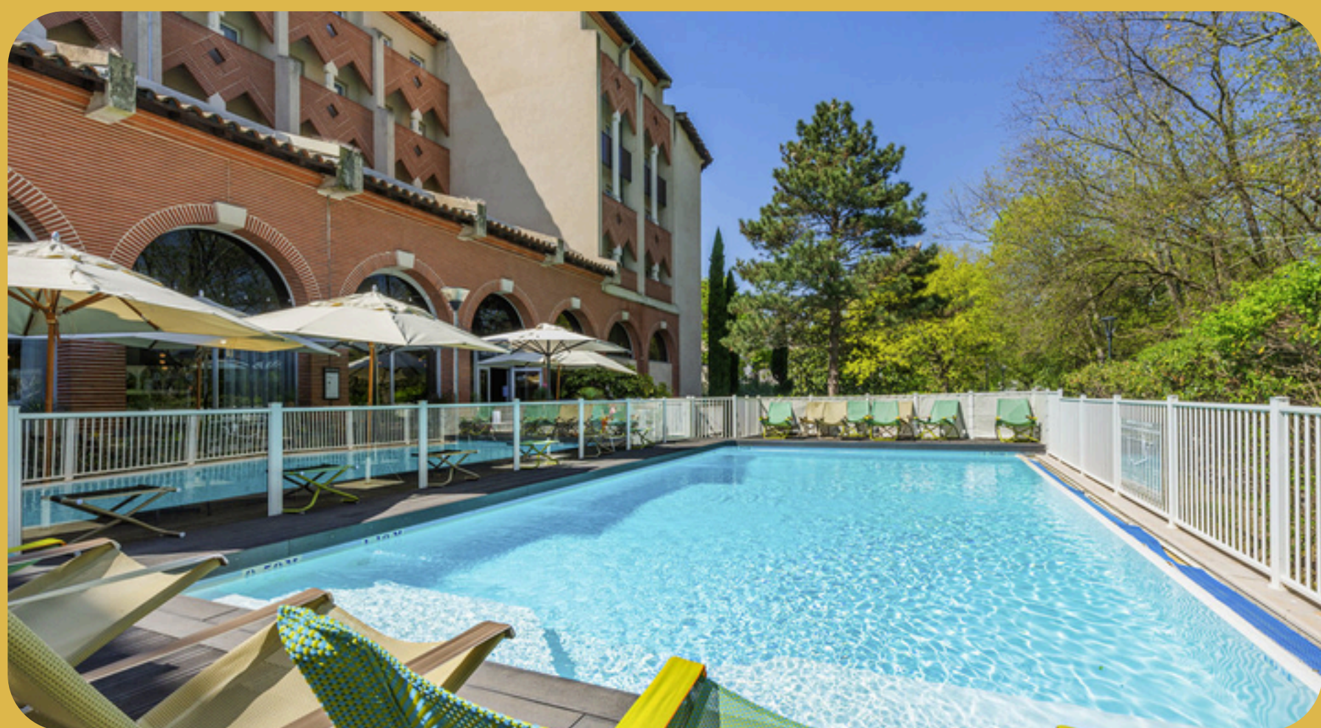
Novotel Centre Compans Caffarelli Toulouse