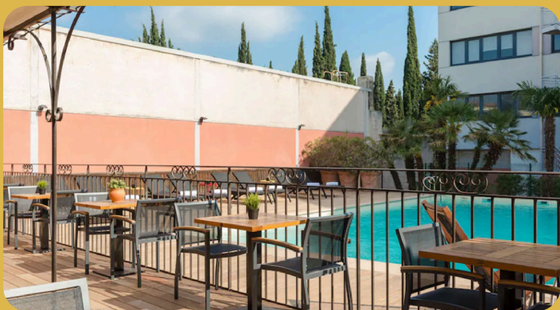
Best Western La Galice Aix-en-Provence