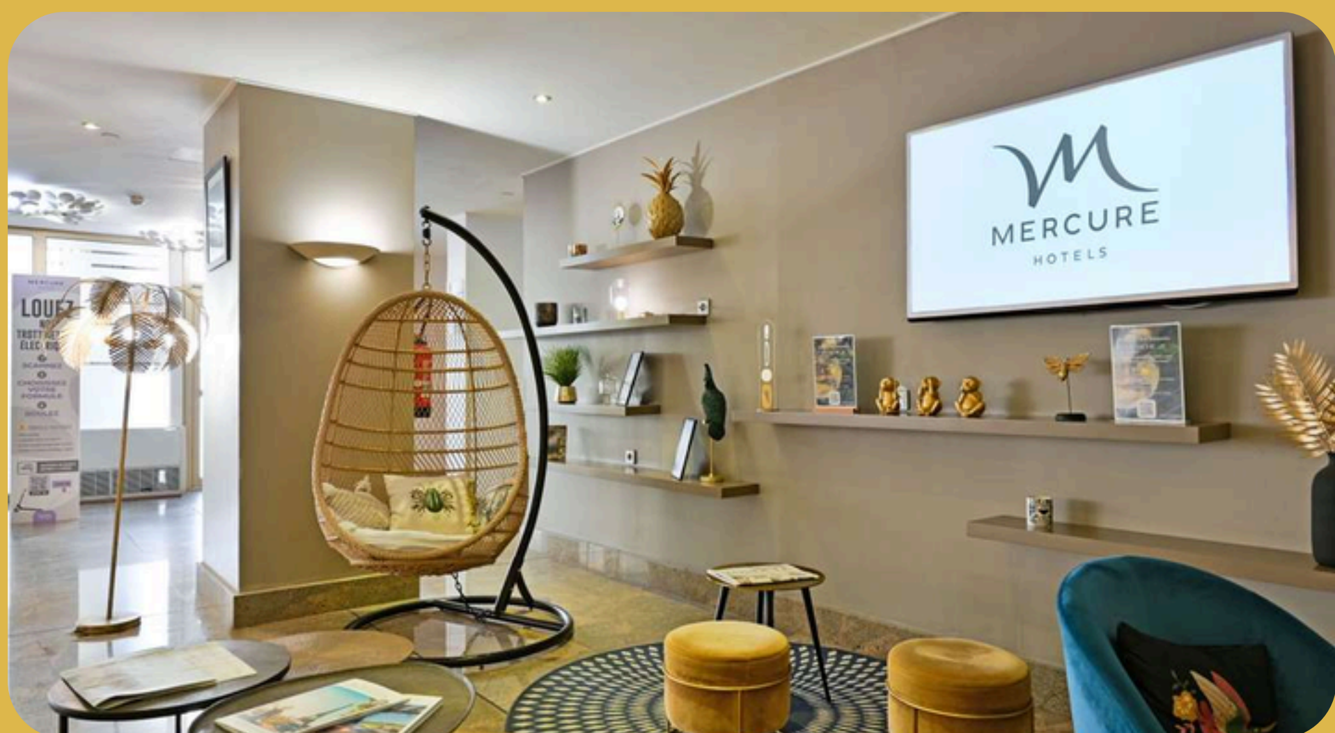
Mercure Marseille Centre Vieux Port Marselha