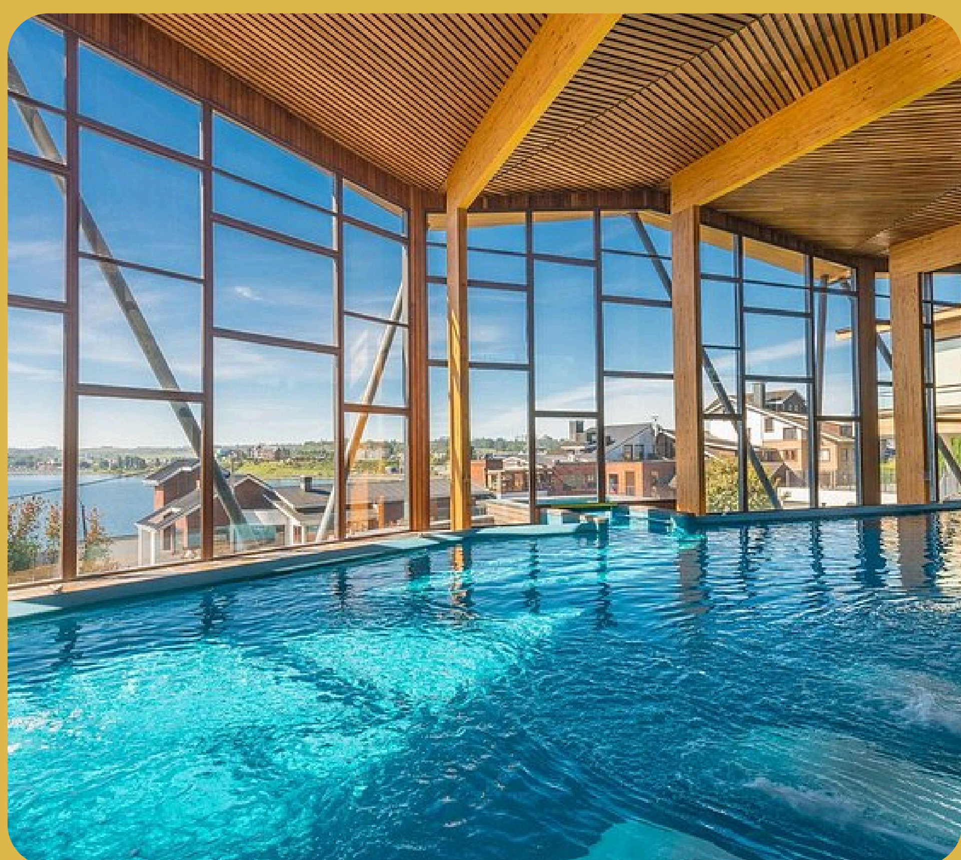
Cabañas del Lago Puerto Varas