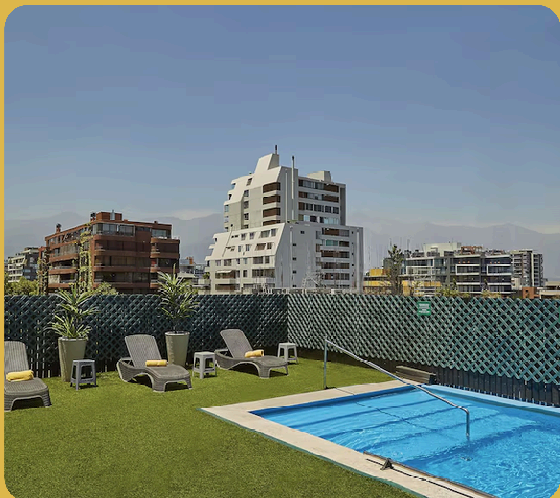
Torre Mayor Lyon Santiago