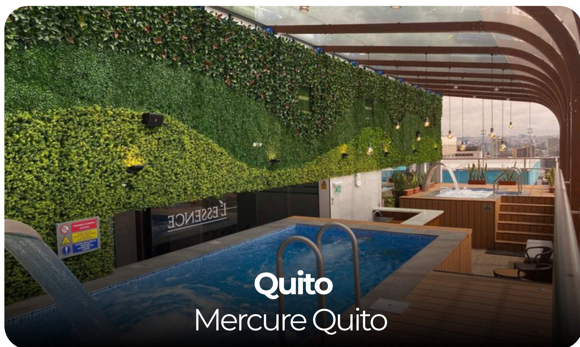
Quito Mercure Quito