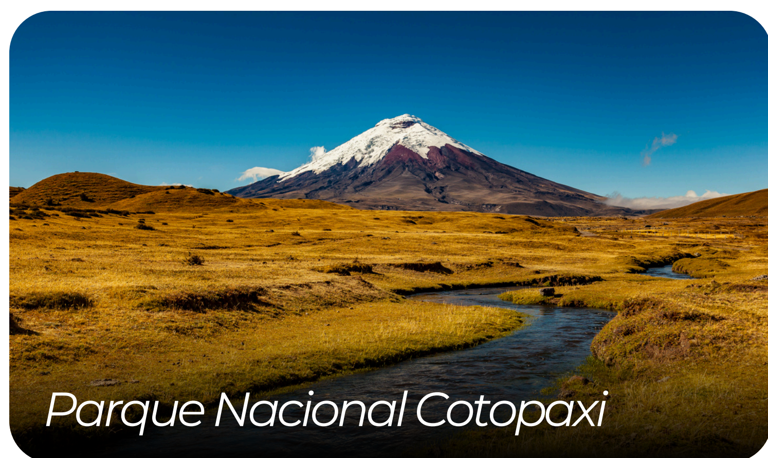
Parque Nacional Cotopaxi