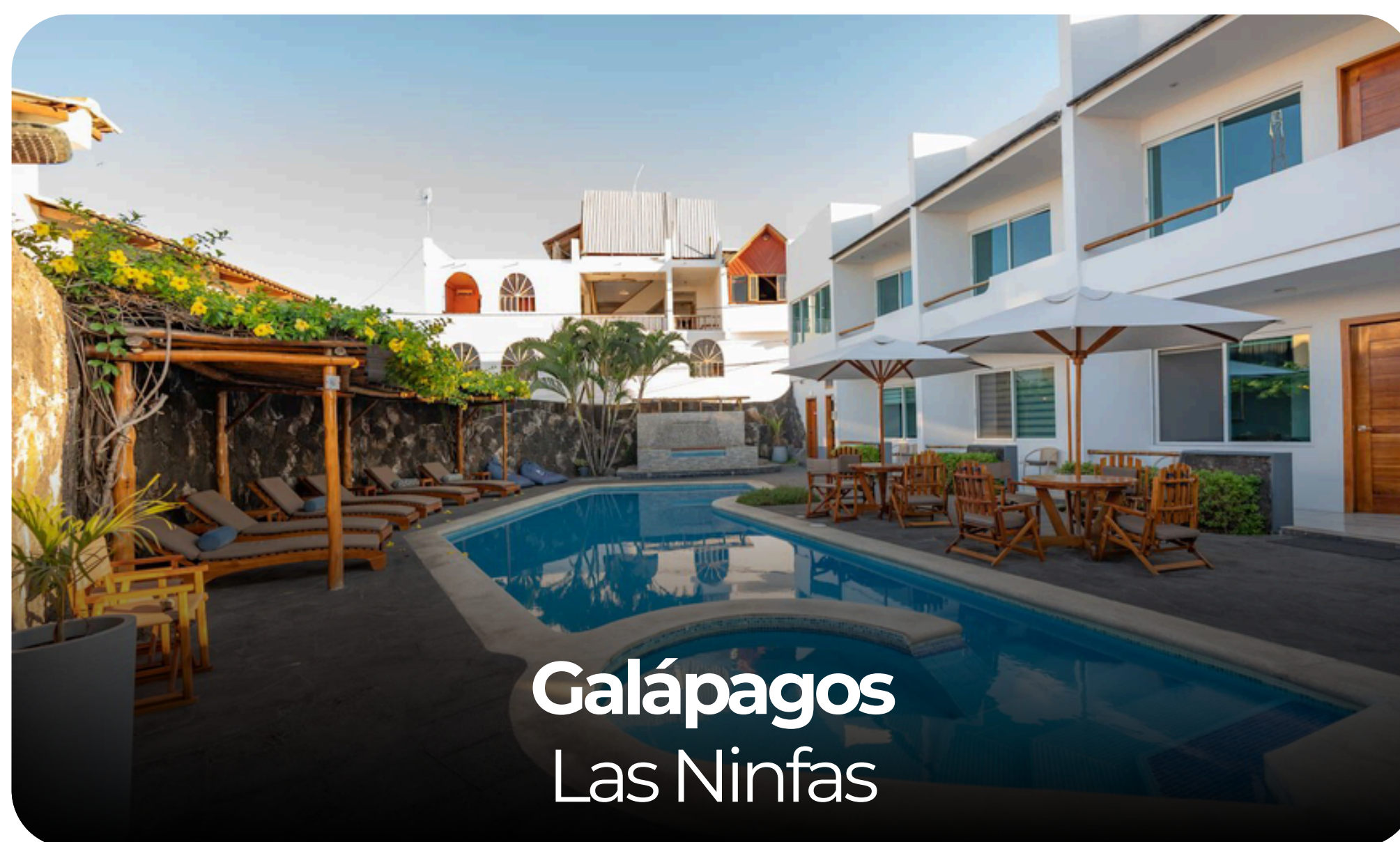
Galápagos Las Ninfas