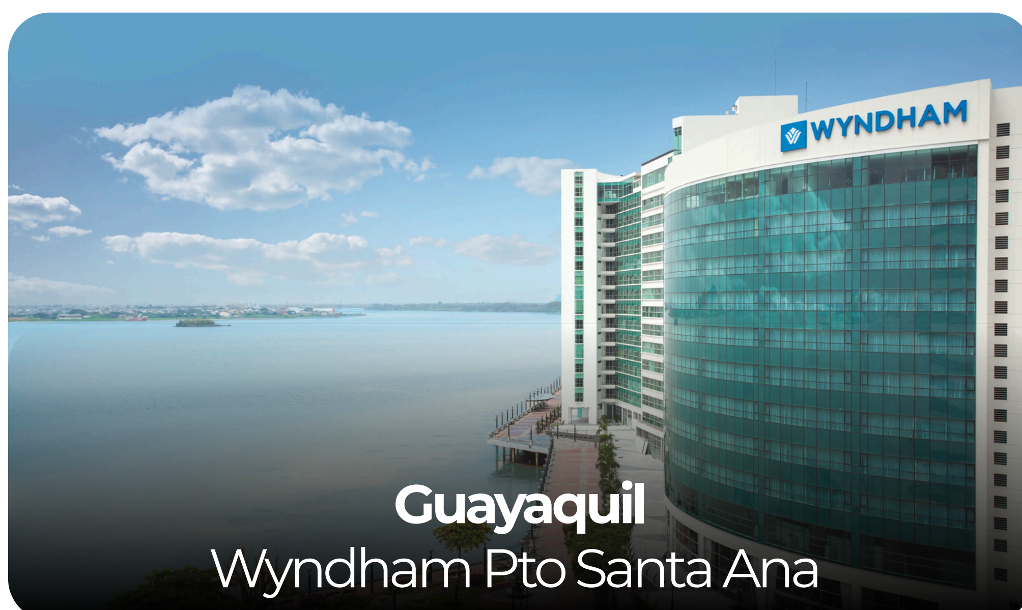
Guayaquil Wyndham Pto Santa Ana