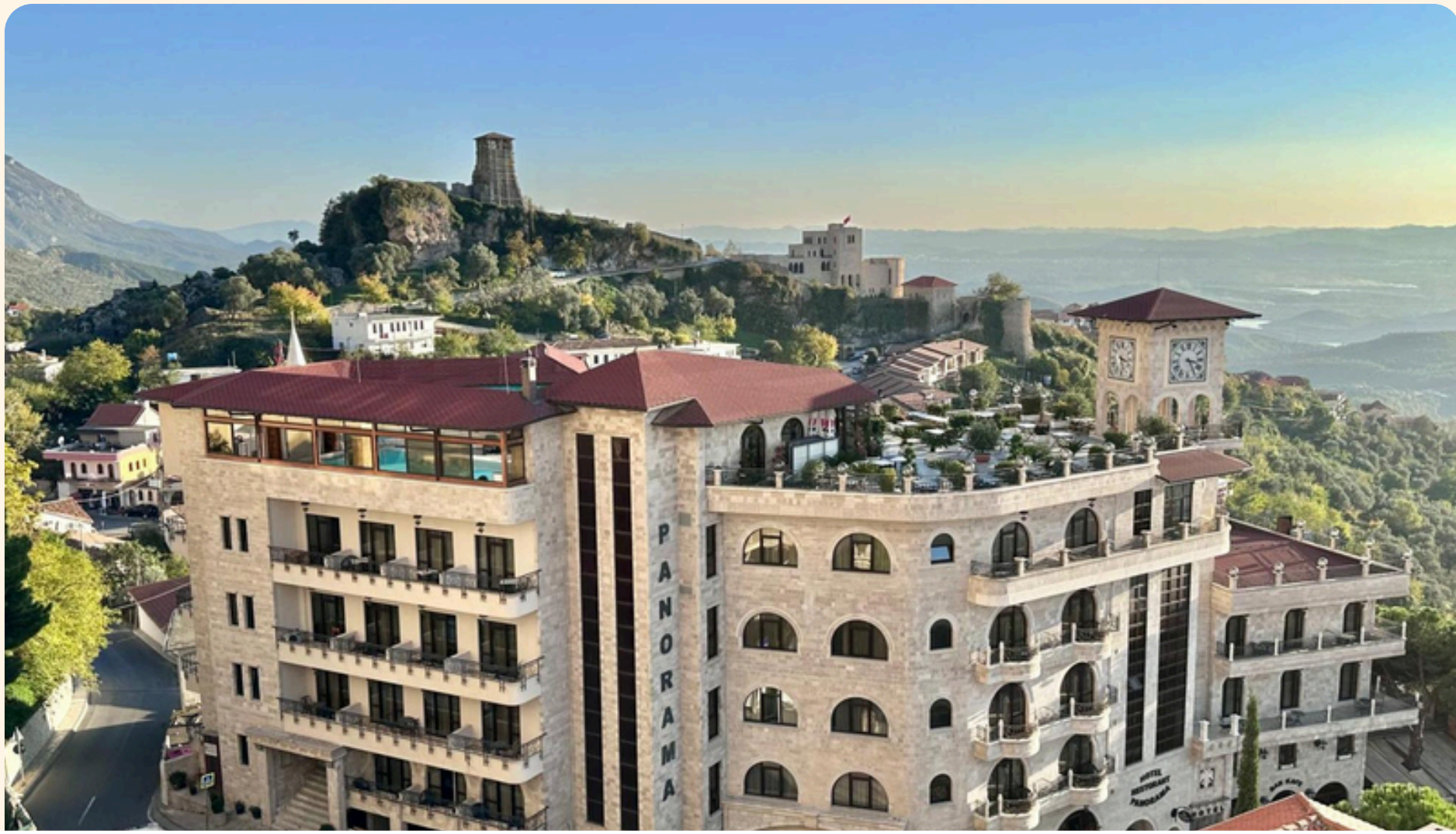
Kruje Panorama Hotel