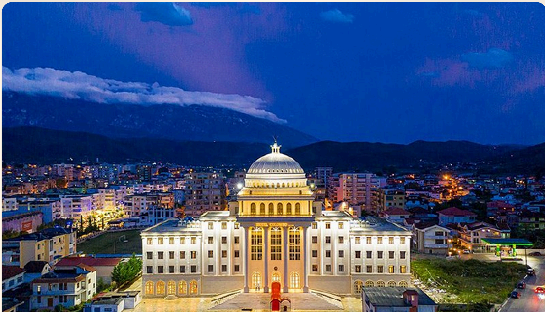
Berat Colombo Berat