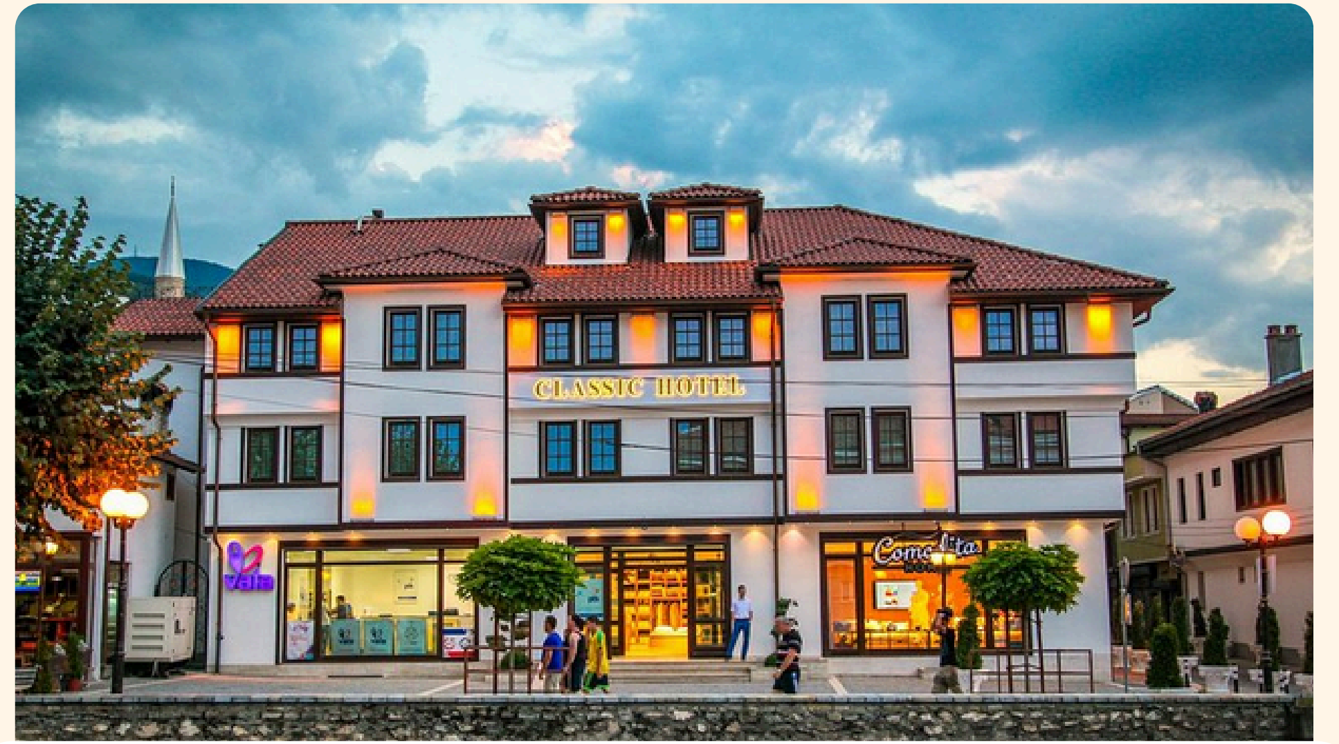
Prizren Prizren Classic