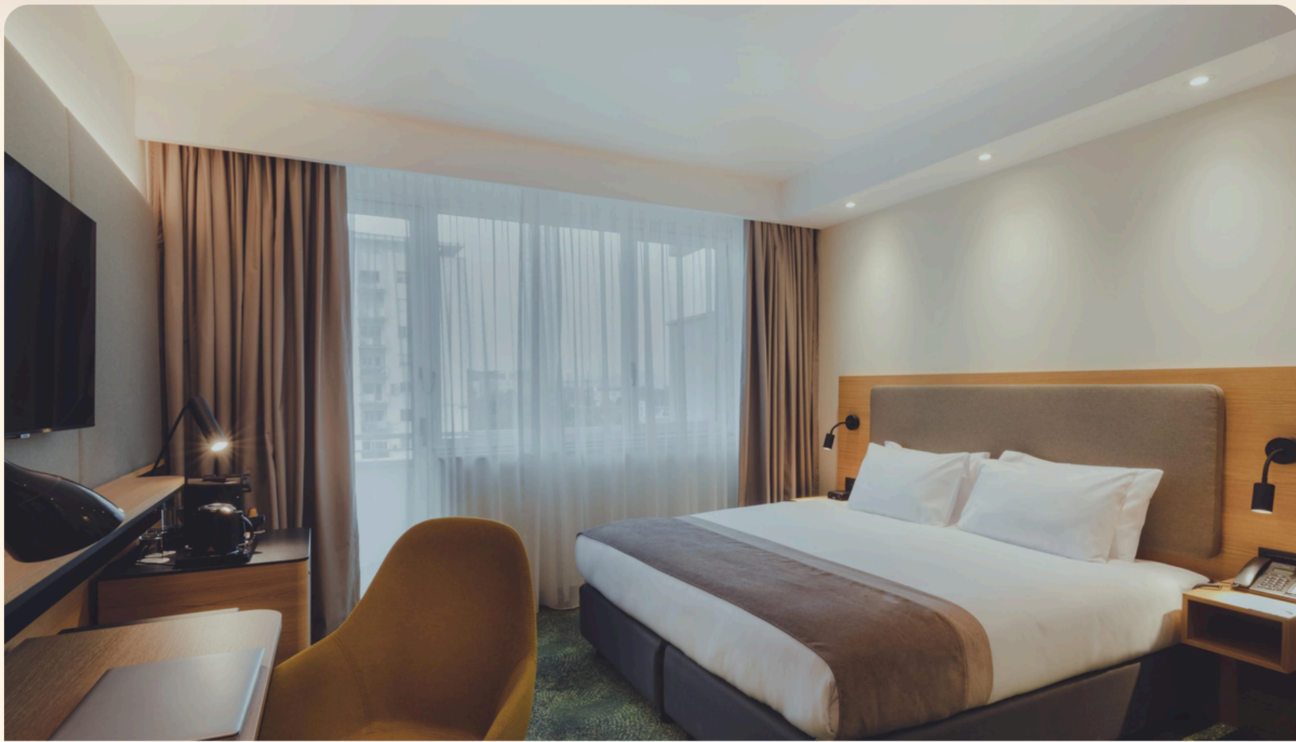
Skopje Holiday Inn Skopje