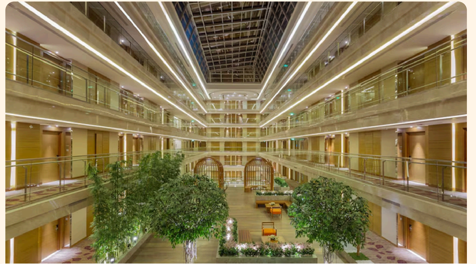
Jaipur Holiday Inn City Centre