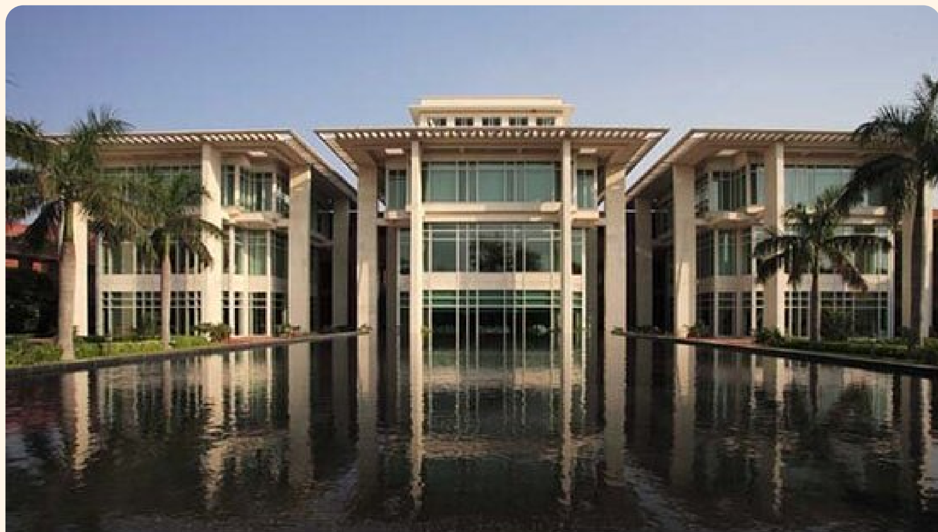
Agra Jaypee Palace