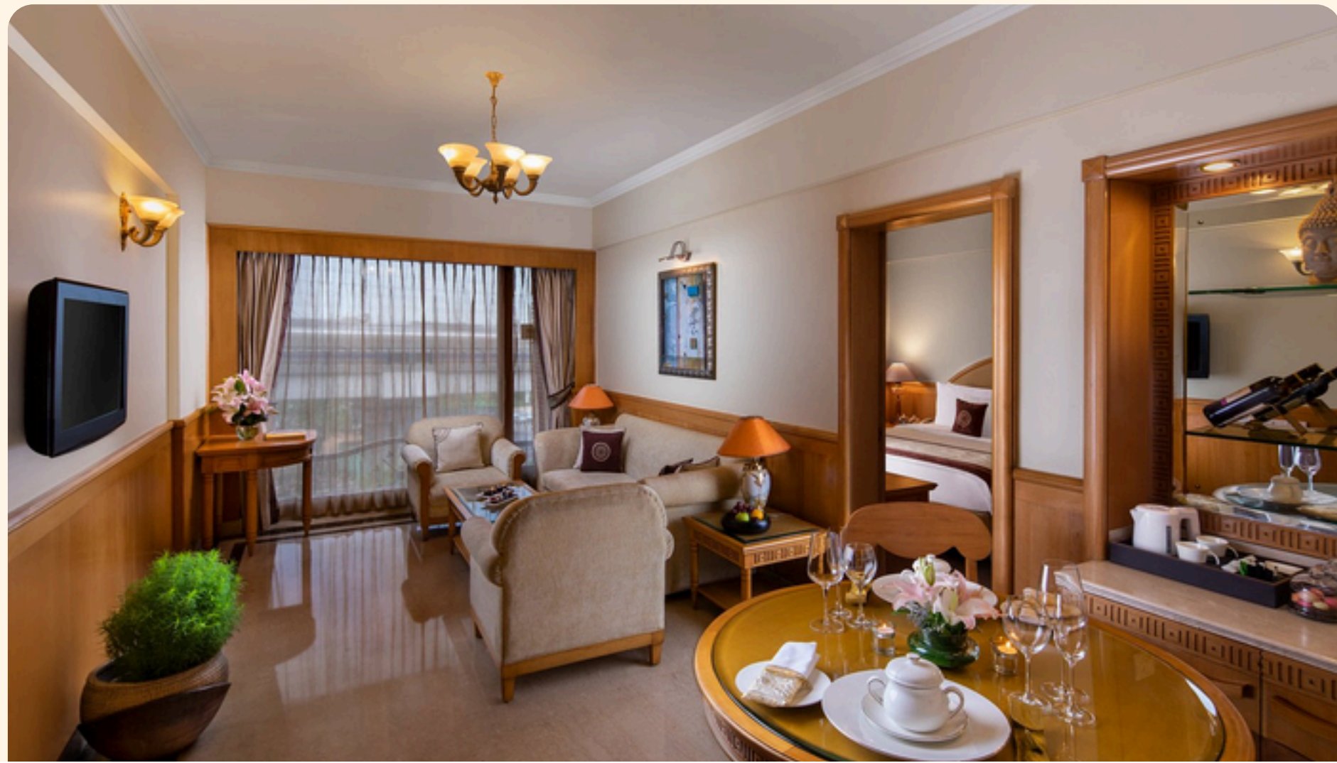
Delhi Jaypee Siddarth