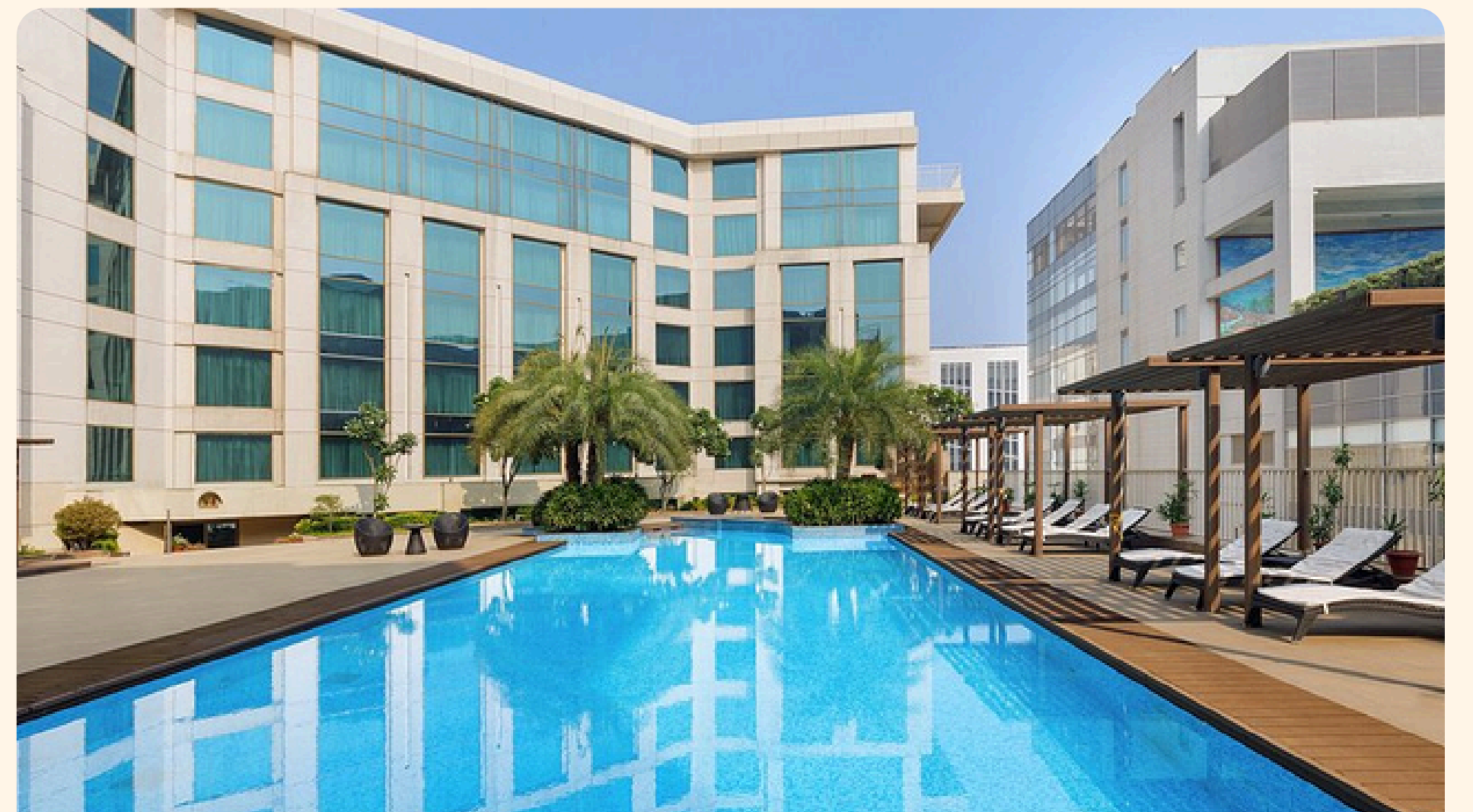
Delhi (Day Use) Pride Plaza