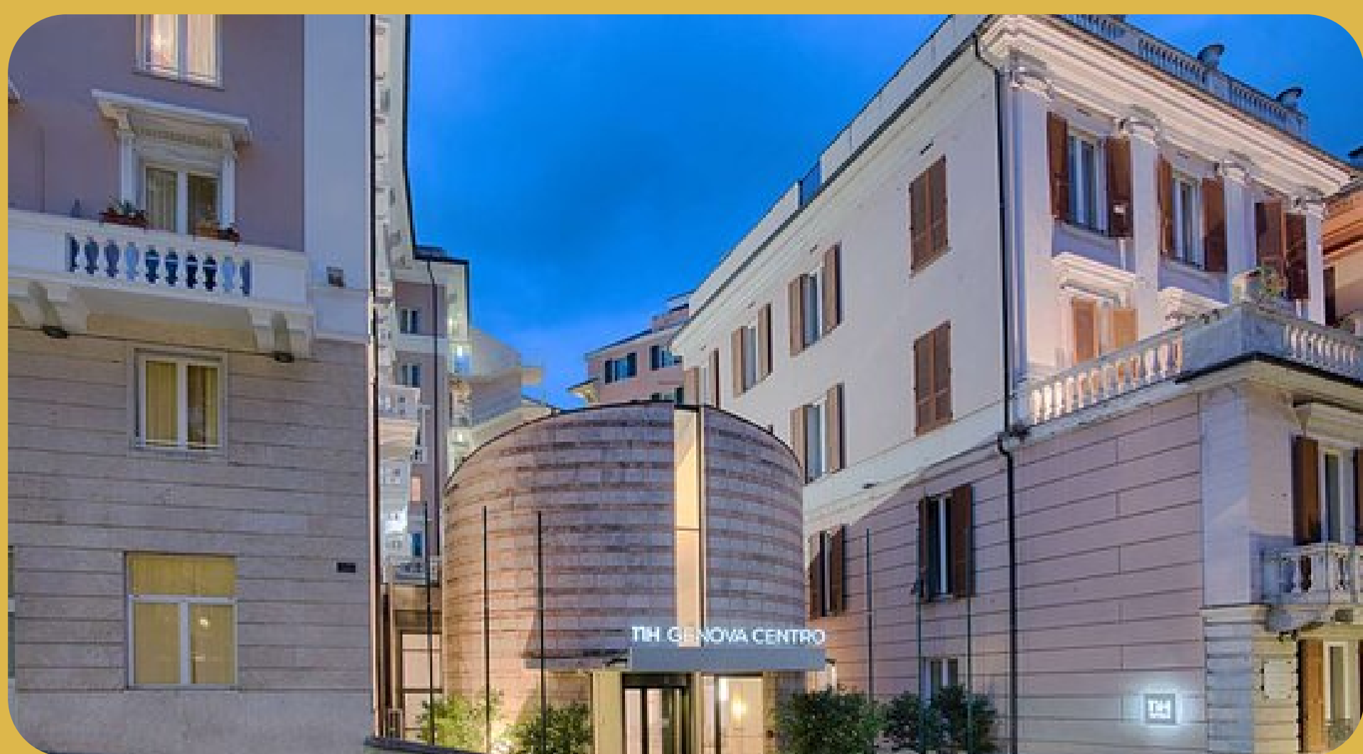
NH Genova Centre Gênova