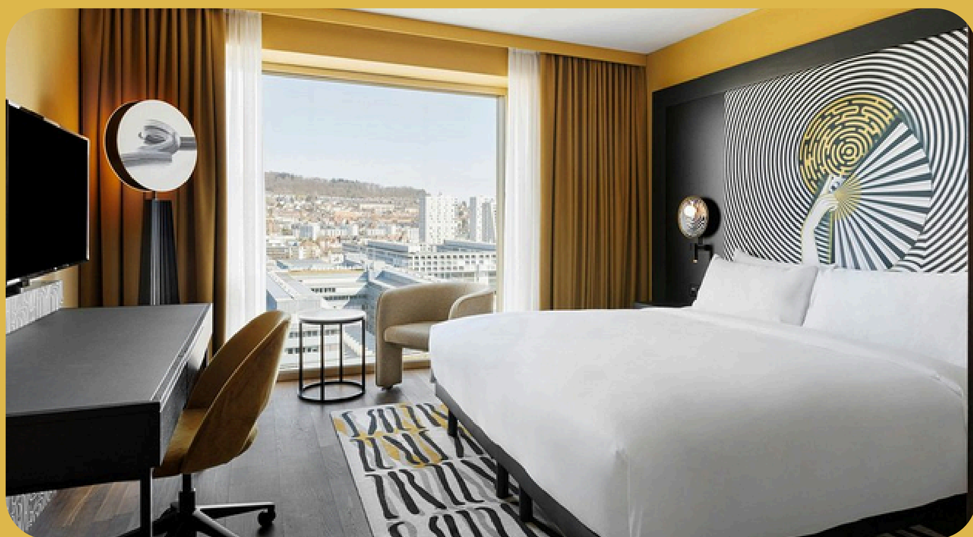
Renaissance Zurich Tower Zurich