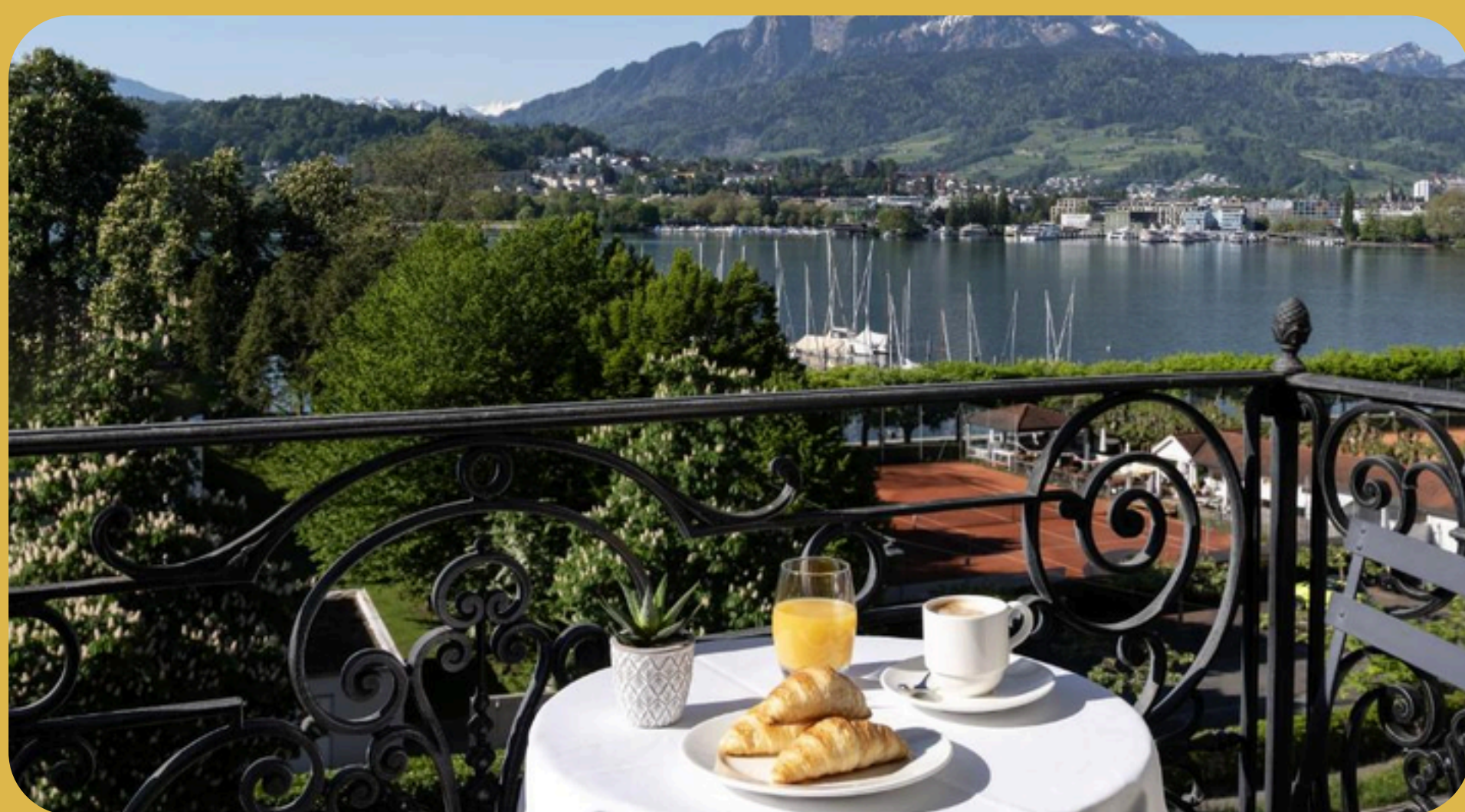
Gran Europe Lucerna