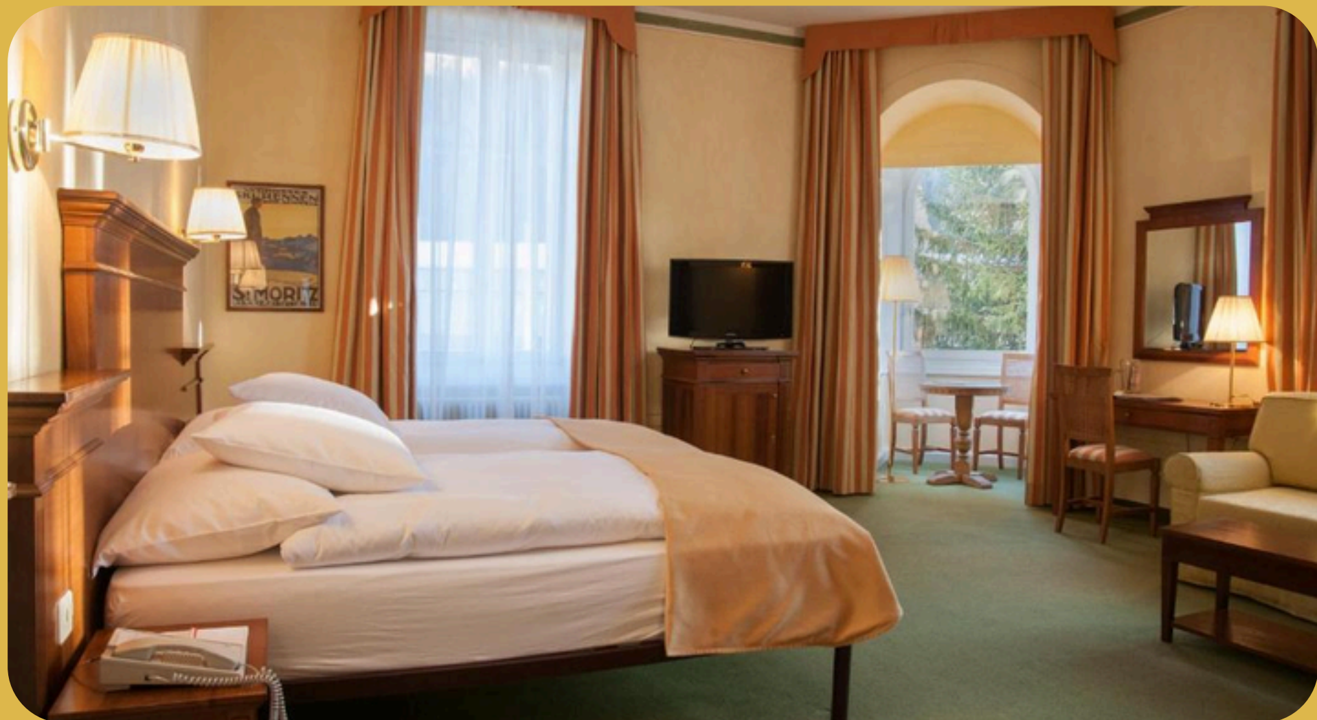
Reine Victoria by Laudinella St Moritz