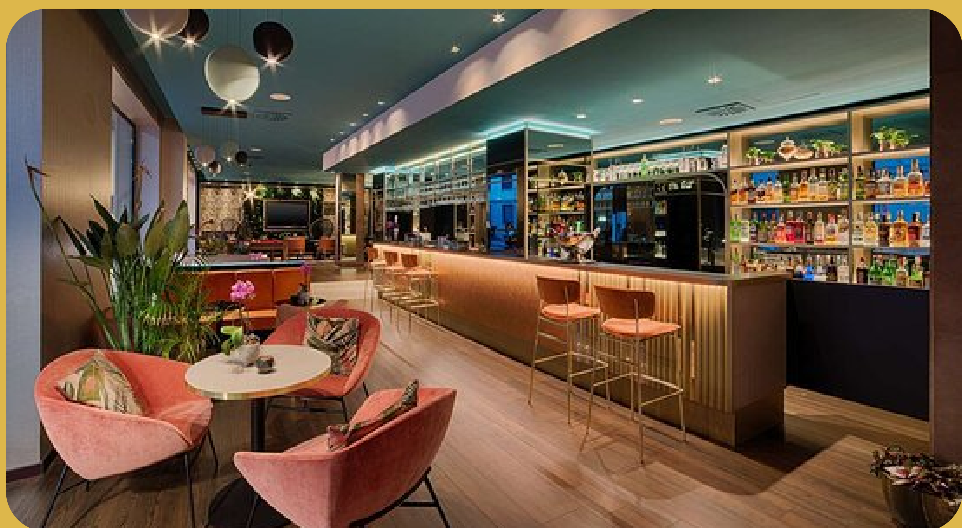
NH Milano Touring Milão