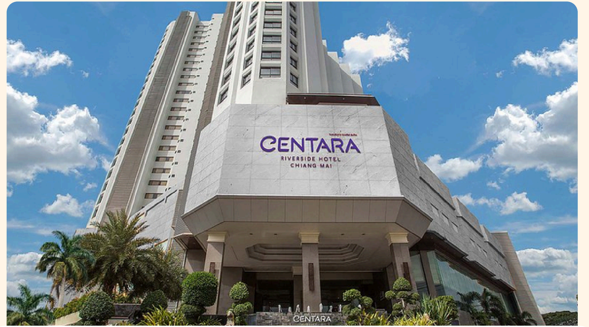
Chiang Mai Centara Riverside