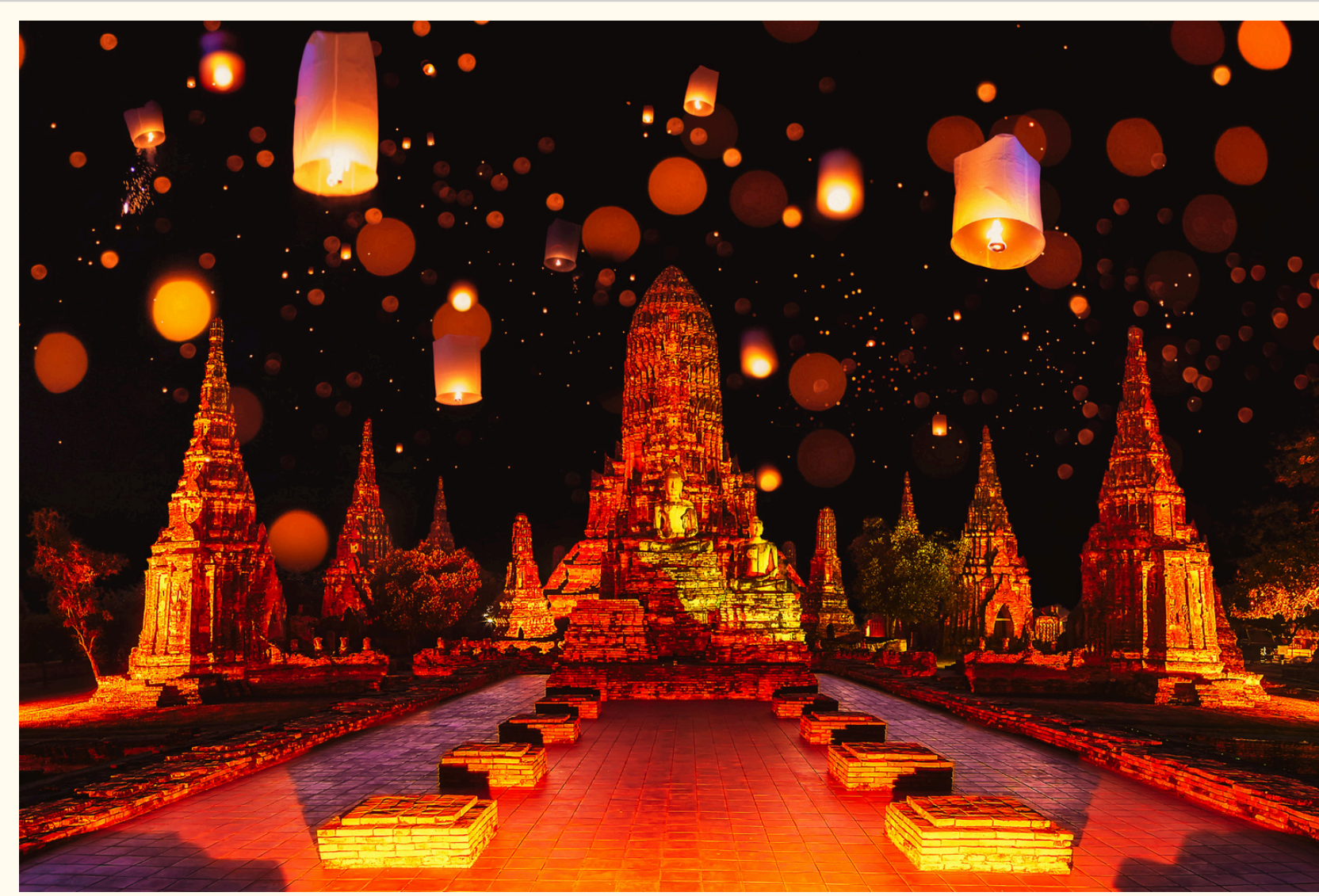
Festival das Lanternas