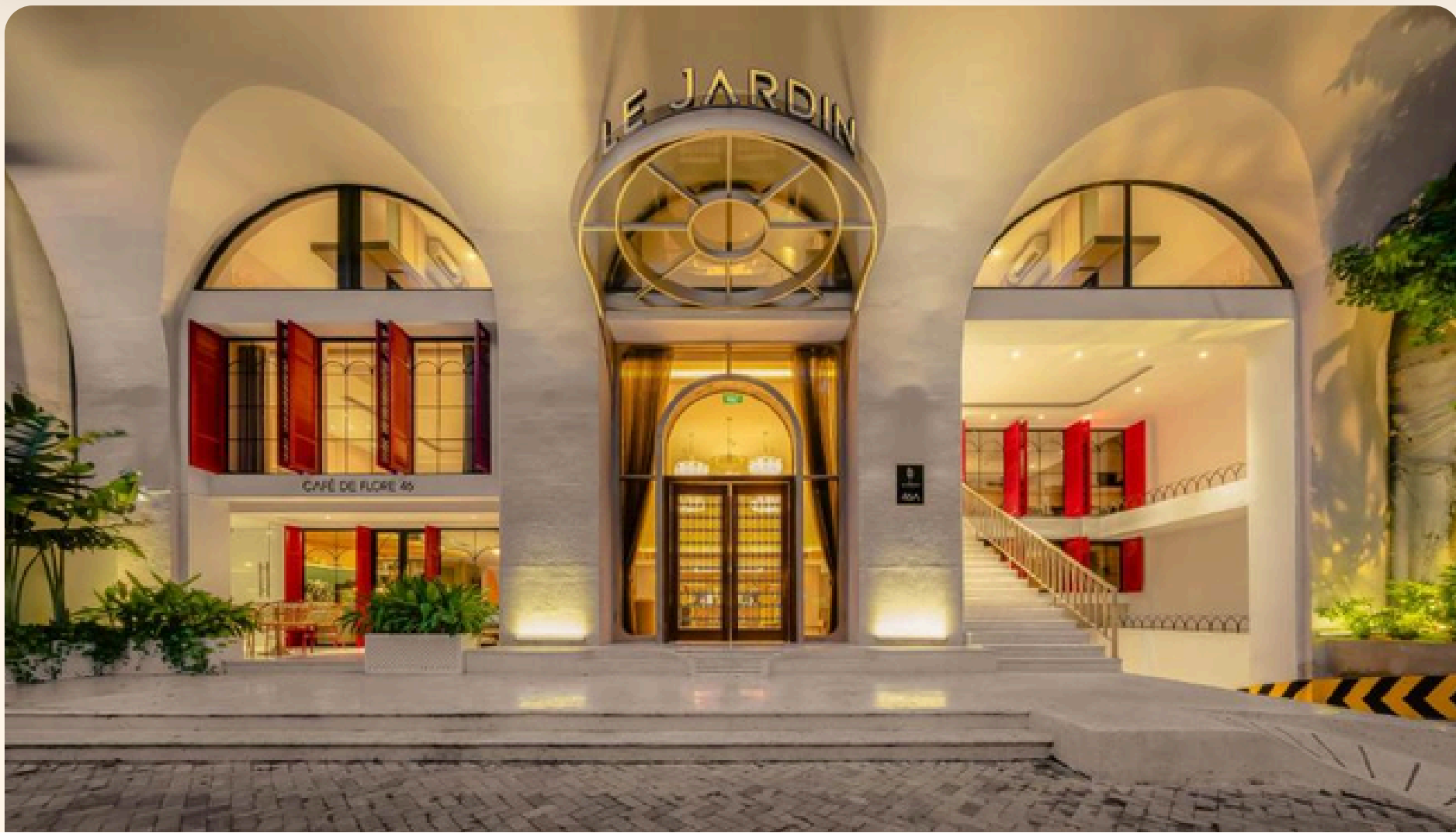
Hanoi Le Jardin