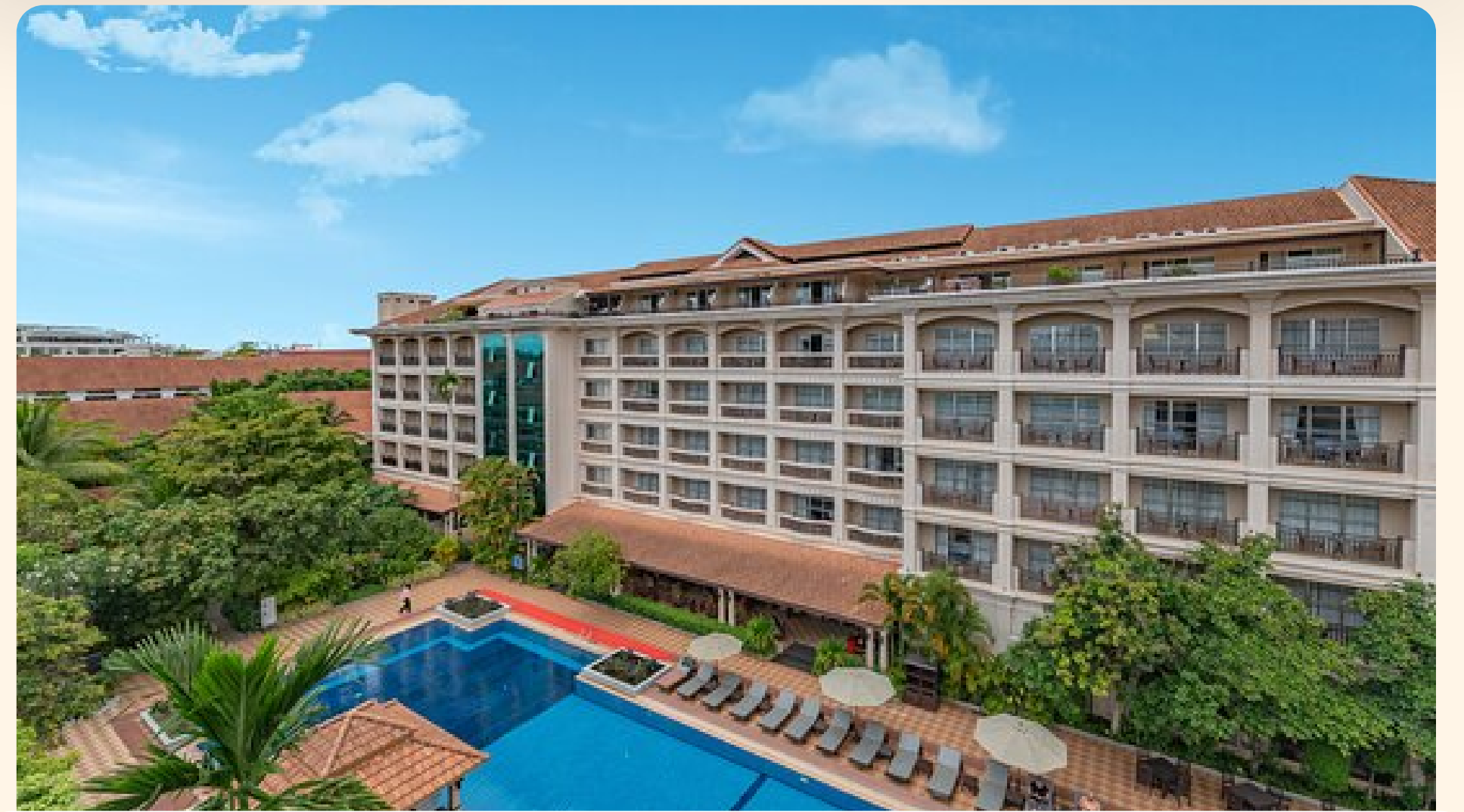
Siem Reap Somadevi Angkor