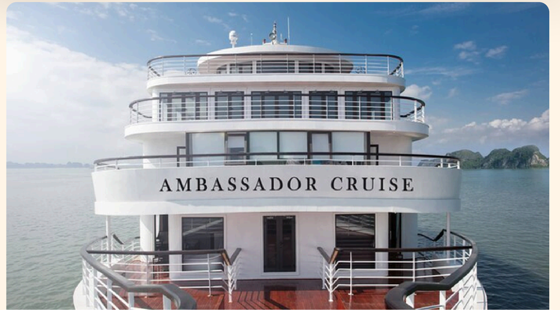
Halong Ambassador Cruise