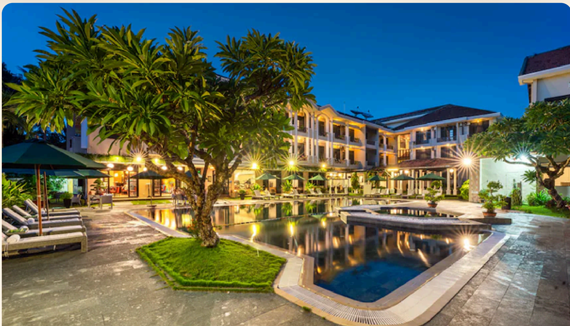
Hoi An Historic Hoi An