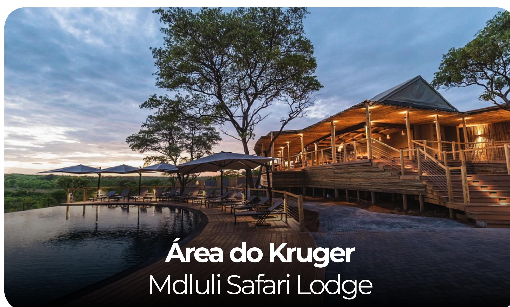
Área do Kruger Mdluli Safari Lodge