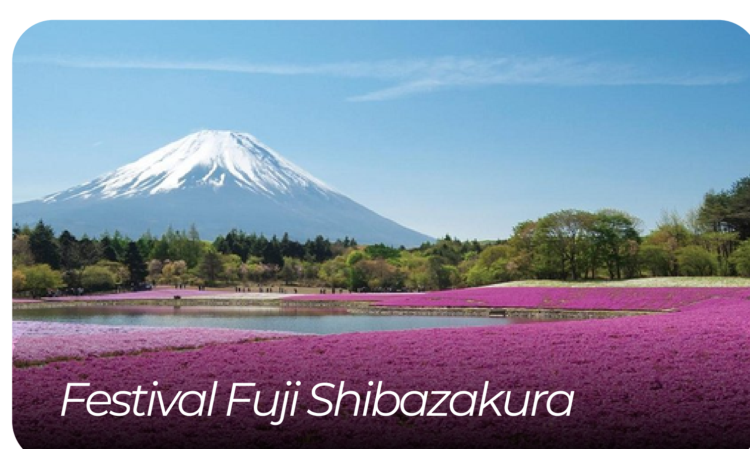
Festival Fuji Shibazakura