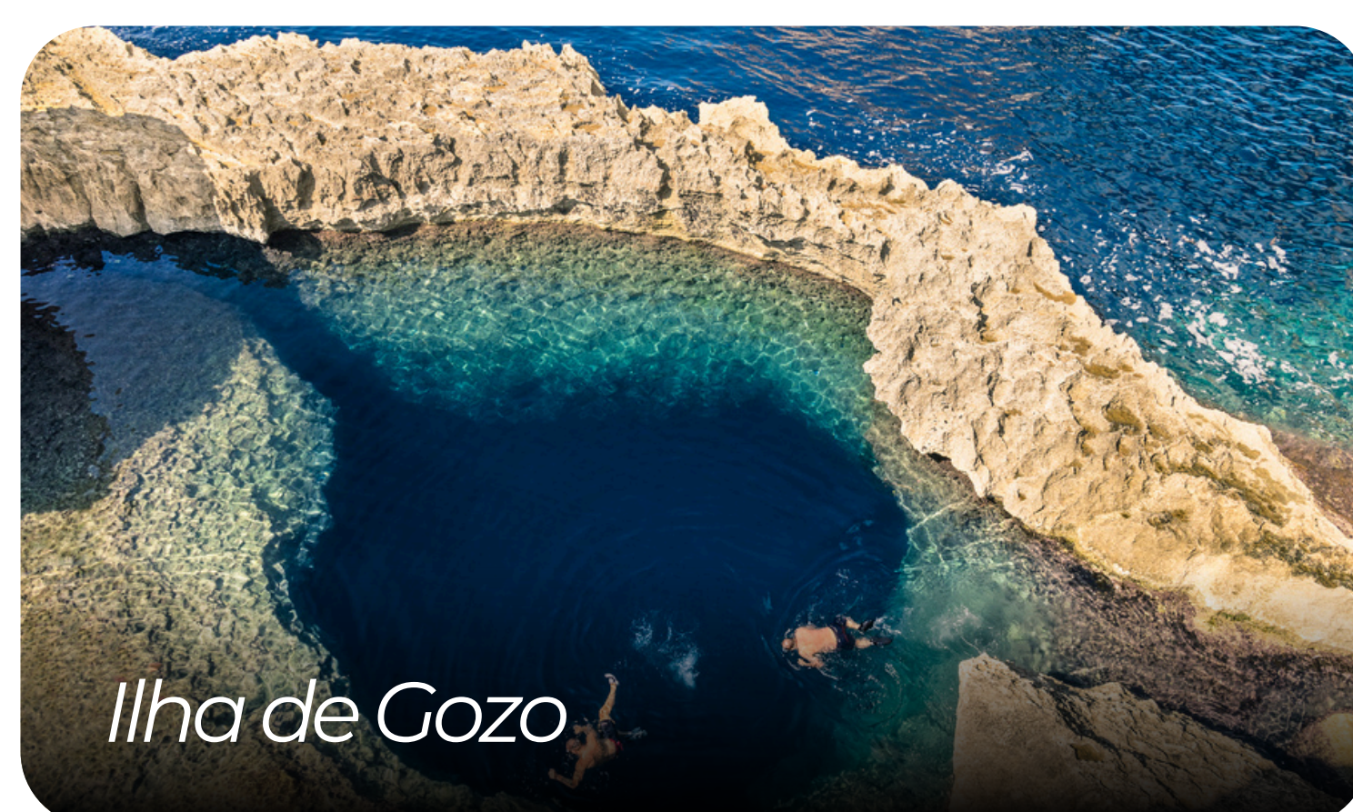
Ilha de Gozo