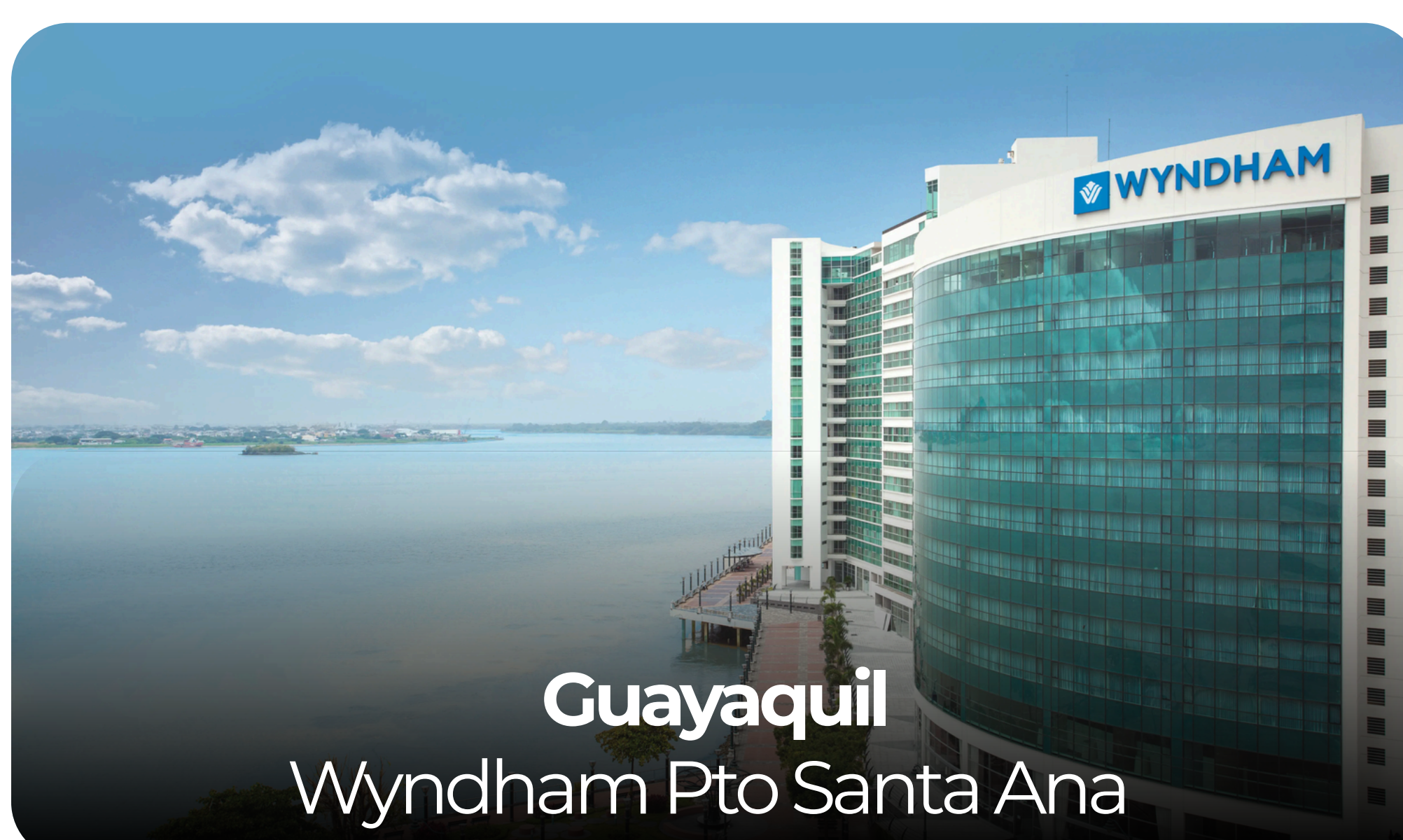
Guayaquil Wyndham Pto Santa Ana