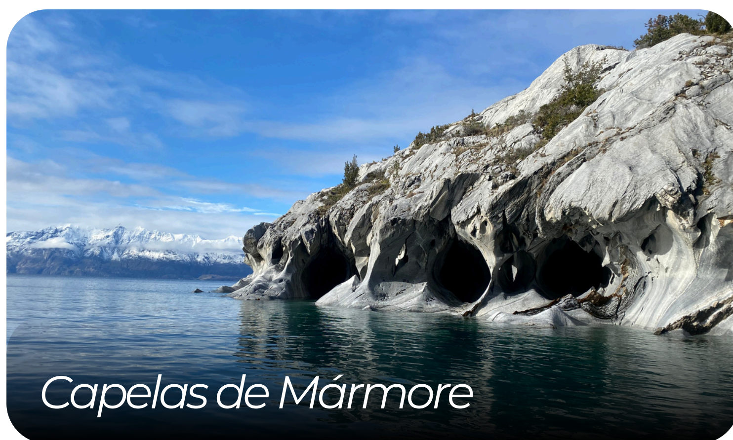
Capelas de Mármore