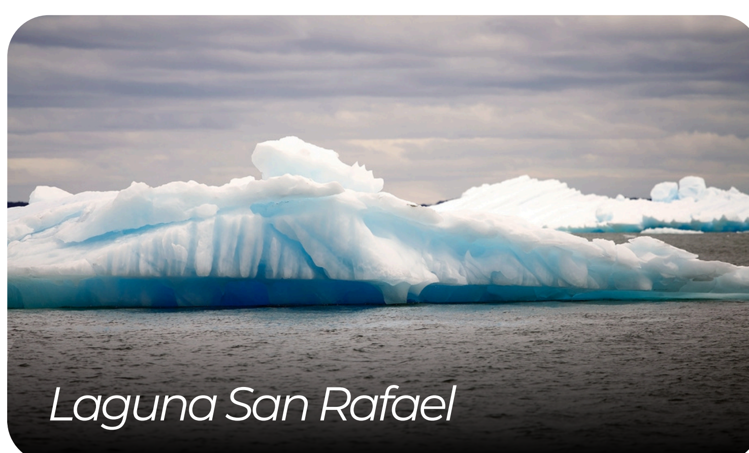
Laguna San Rafael