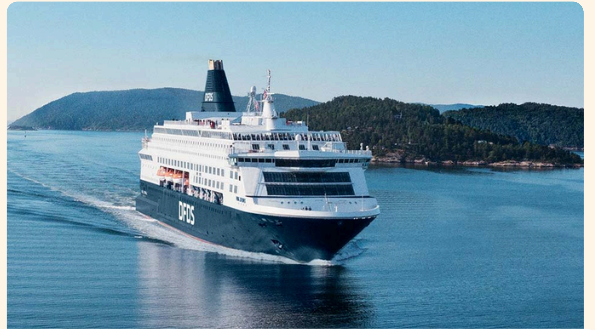
Copenhagen - Oslo DFDS Seaways