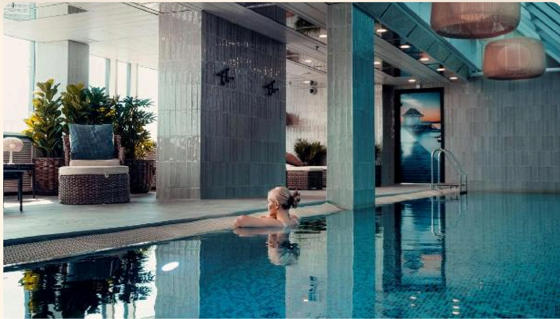
Oslo Radisson Blu Oslo