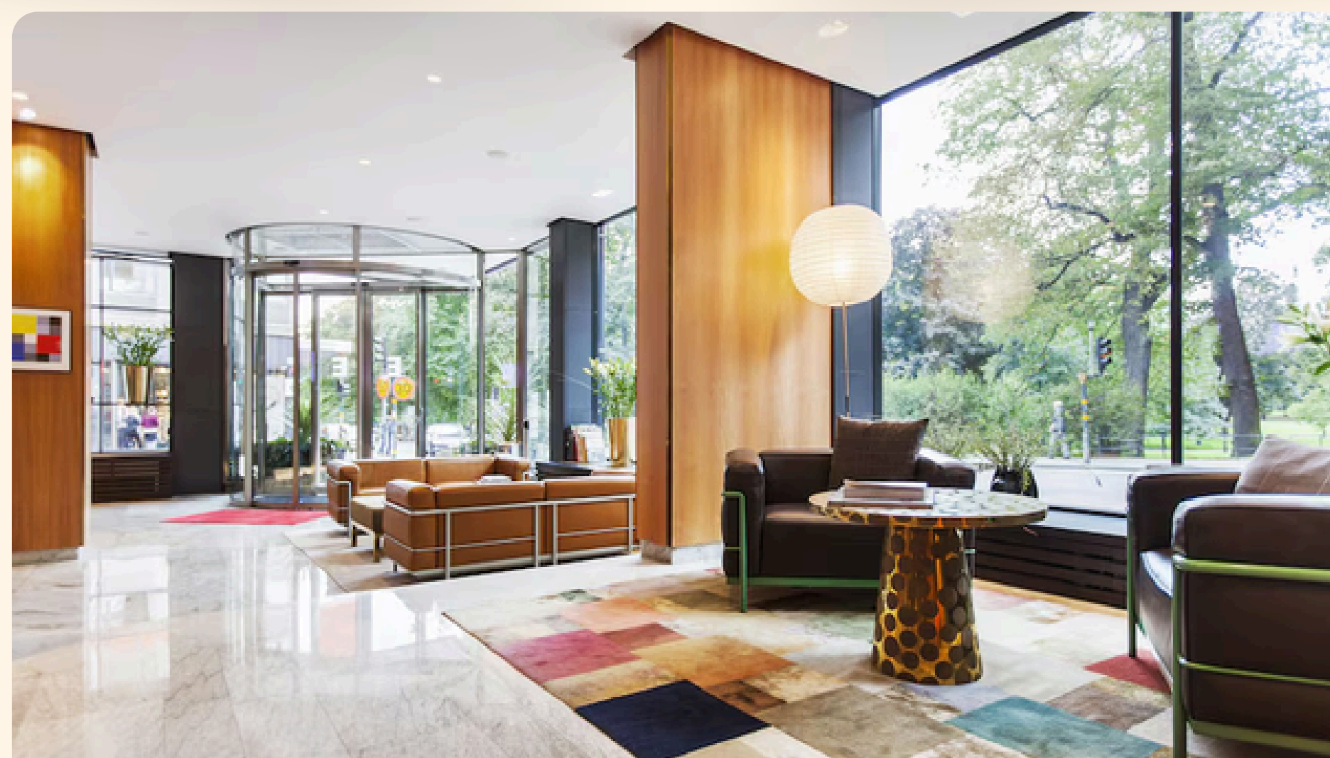
Estocolmo Elite Eden Park