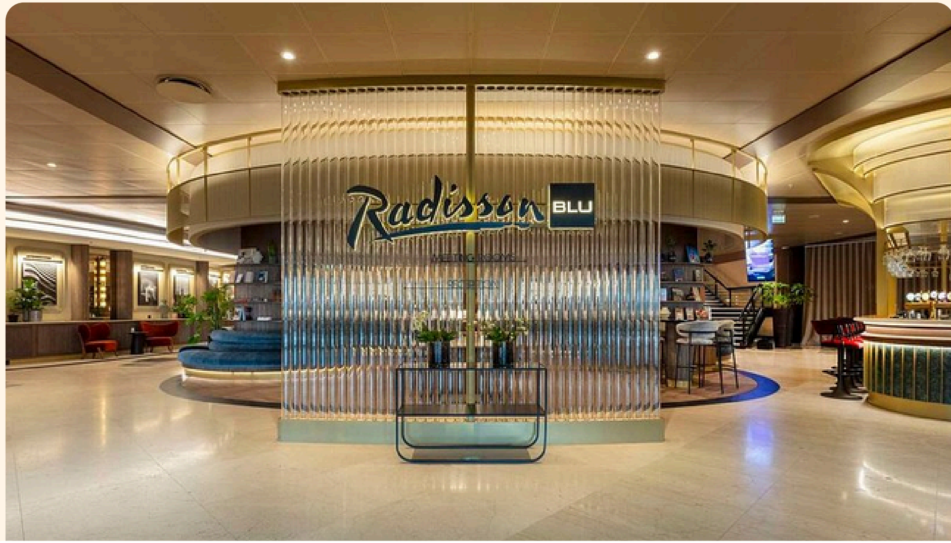
Copenhagen Radisson Blu Scandinavia