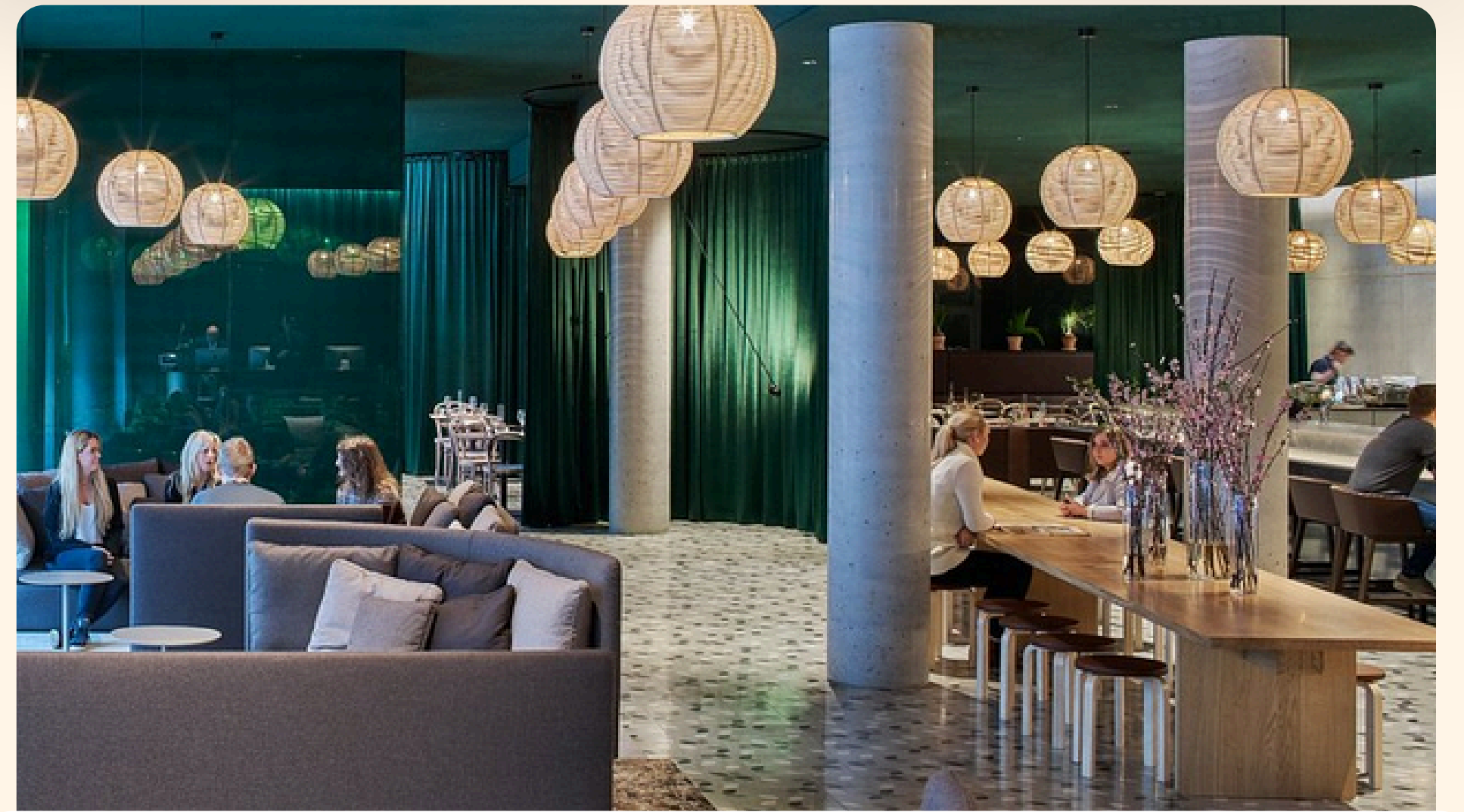
Bergen Zander K