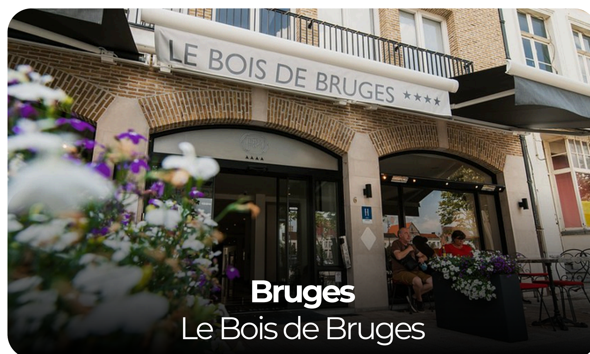
Bruges Le Bois de Bruges