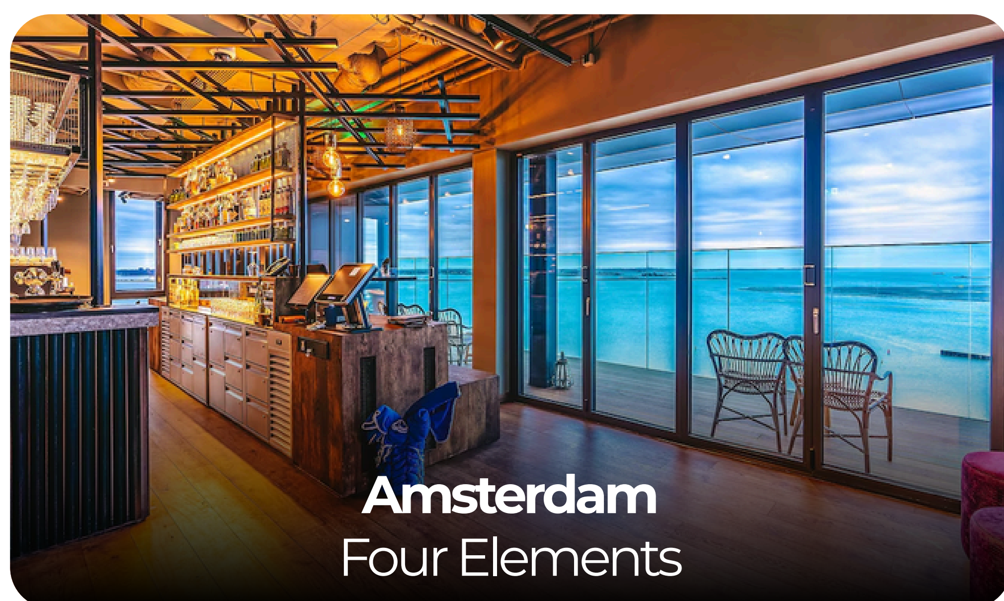
Amsterdam Four Elements