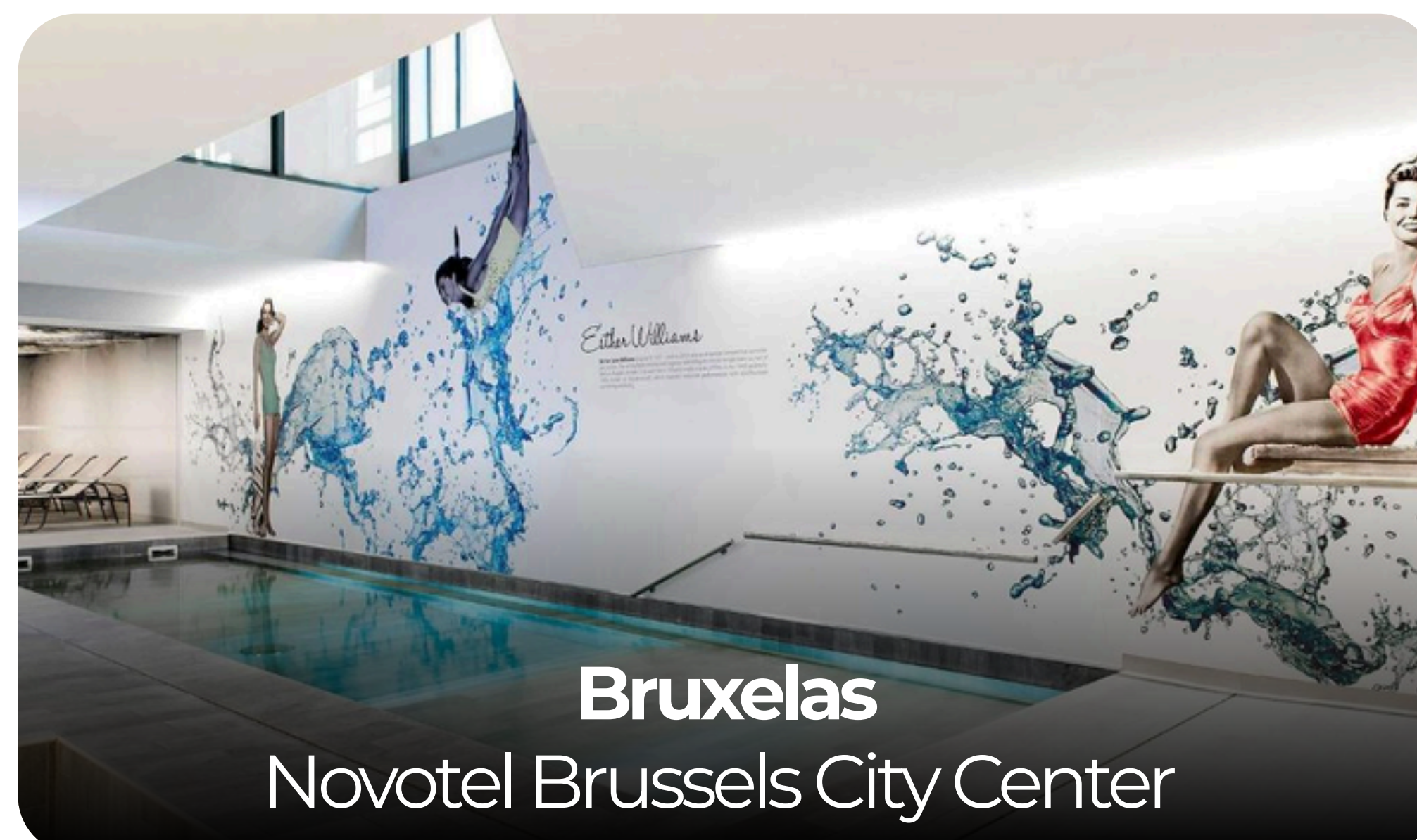
Bruxelas Novotel Brussels City Center