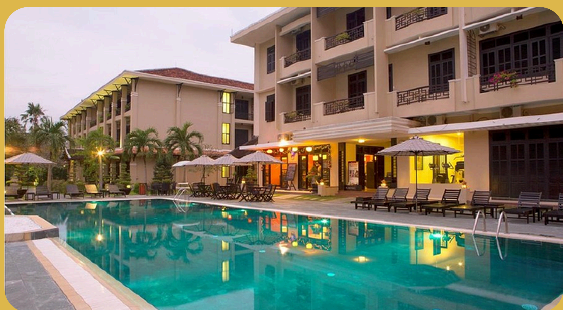
Historic Hoi An Hoi An