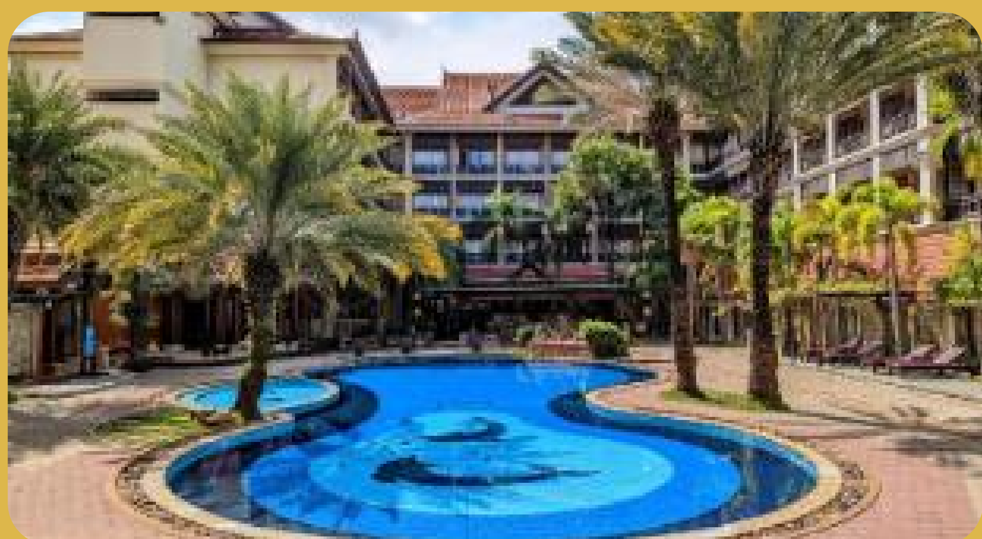
Empress Angkor Siem Reap