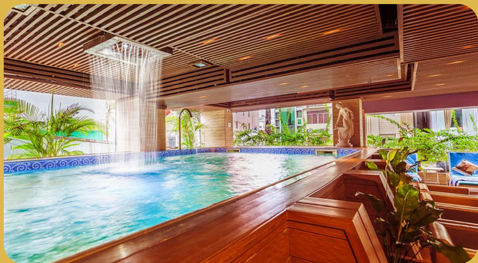
Harmony Saigon Saigon