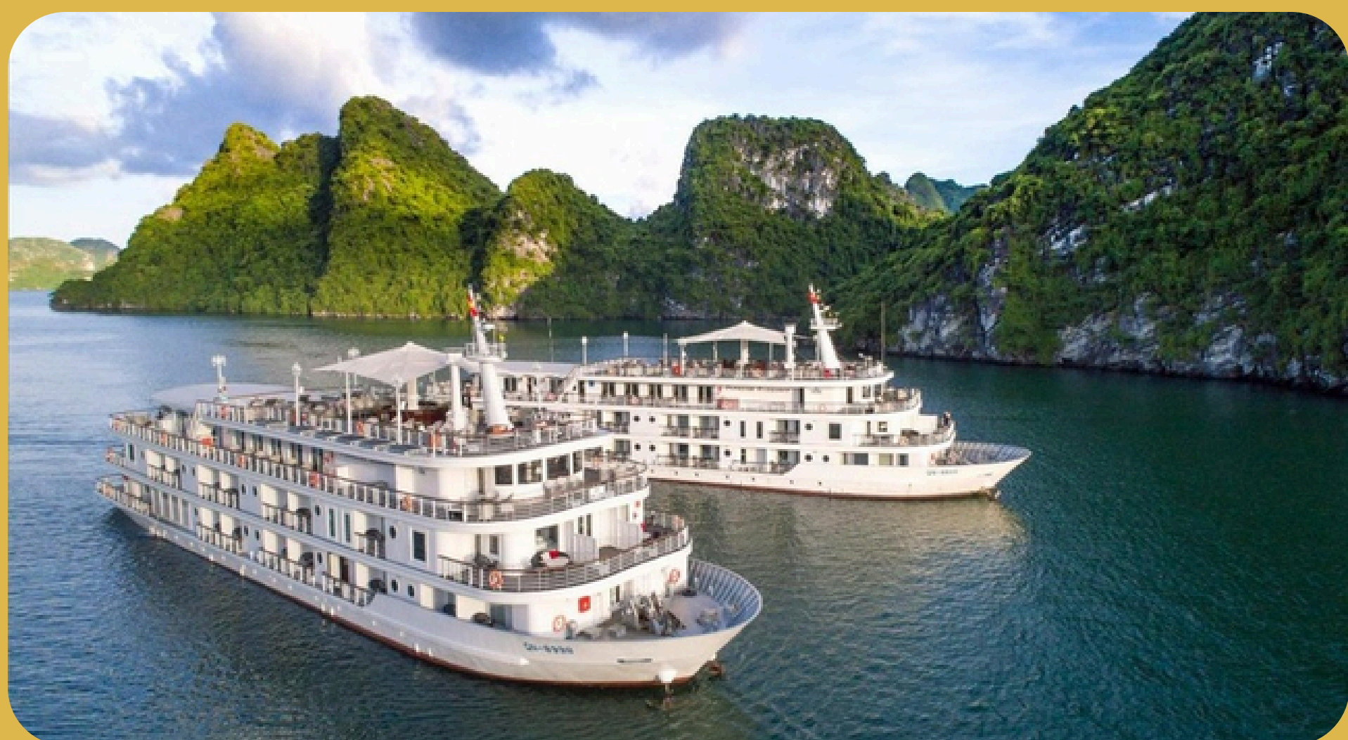
Paradise Elegance Cruise Halong