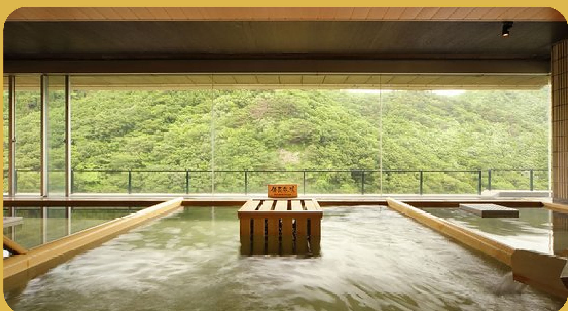
Hotel Hana no Yu