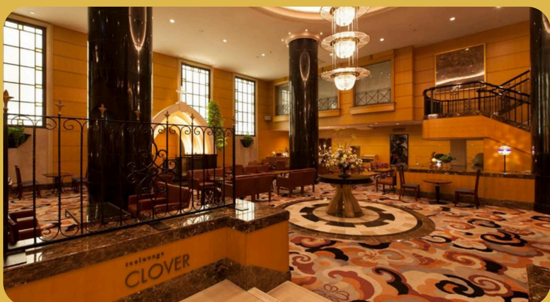
Hotel Metropolitan Morioka New Wing